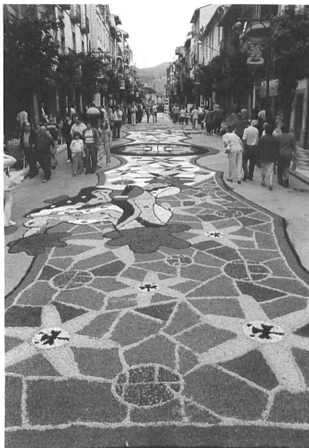
Museu Etnològic La Garriga (Arbúcies)

El contrapunt podria ser l'Exposició de Flors de Banyoles, que s'ha captivat sense caure en la temptació i ha viscut una certa estabilitat amb una dimensió més que remarcable dins de la comarca, però sense la projecció d'Arbúcies o de Peralada. En la darrera edició, la vint-i-setena, l'Exposició de Flors de Banyoles va atraure entre sis mil i set mil persones, però l'orientació que té és ben diferent de les altres. La mostra, organitza-