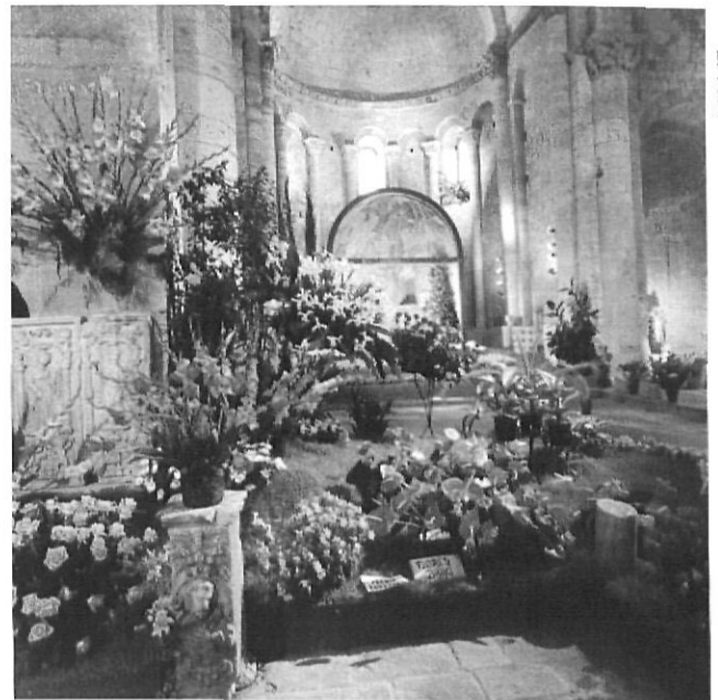
L'exposició de flors de Girona de l'any 1979 a Sant Pere de Galligants.

Ningú no pot posar en dubte l'èxit turístic i econòmic de l'Exposició de Flors de Girona: s'ha introduït de ple dret en els circuits turístics, augmenta l'aflluència de públic els dies feiners gràcies a visitants que fugen de les cues però no renuncien a l'expo-