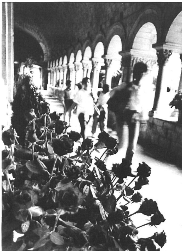
Una imatge del Claustre de la Catedral de Girona l'any 1993.