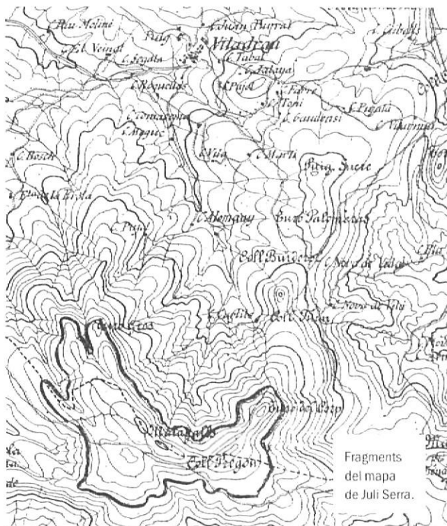
Fragments del mapa de Juli Serra.

Fins avui, es coneixia aquest mapa en una escala de 1:50.000 (1,20 metres d'alçada per 0,90 m d'amplada). Els cartògrafs només es referien a aquesta versió. Però, durant la recerca, conjuntament amb Emili Rams, del llibre Un viatge per les Guillerias i el Montseny –amb el text complet de Las Guillerias de Juli Serra– vàrem trobar l'article «El plano de las Guillerias» de la Revista de Gerona de l'any 1890. L'autor desconegut de l'article (possiblement Botet i Sisó) diu textualment: «Haremos observar que figuran en el plano, cuya escala