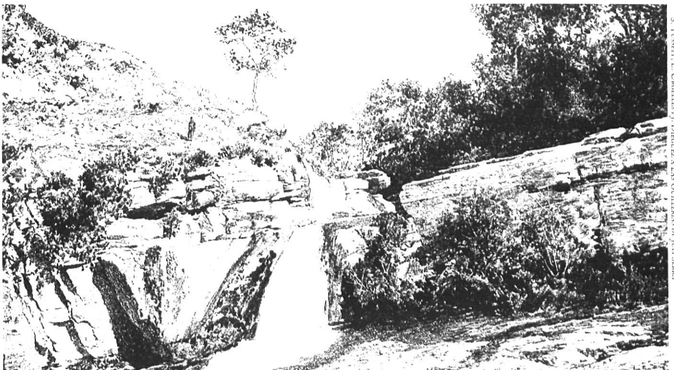
S. TOSCHI, L. URGHESU. | DÈCRET A LAS GUILLERIAS DE JUII SERRA

qüestió, del 10 de maig de l'any 942, els esposos Adalbert i Doda venen a Gonderic una peça de terra, diu, «in comitatum Ausona, in terminio Iovanneto, in parrochia Sancti Ilierii, in loco que dicunt Monte Ausonense». (1) En les ubicacions l'ordre de les referències geogràfiques és sempre, lògicament, progressiva, de major a menor, i aquest és el sentit que cal donar a la ubicació precedent: al comtat d'Osona, al terme de Joanet, a la parròquia de Sant Hilari, al lloc que anomenen Mont Osonenc. L'esment de Sant Hilari situat dins el terme de Joanet no és nou; apareix ja el 919 en una venda de cases i terres. (2) Per tant cal concloure que el Monte Ausonense no és, en aquest moment del segle X, un topònim refe-