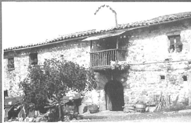
Casa de pagès de Serrallonga l'any 1950.