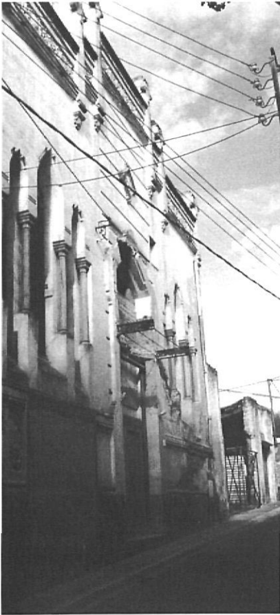
El teatre cinema Fontova, inaugurat el 1900, convertit avui en sala polivalent.

de la mateixa, tindrà cura d'anar tocant un timbal perquè les perdius i demés bestioles del bosc es mantinguin al seu domicili. Aquest mateix empleat irà dient sempre, en tant no s'arribi al lloc de parada: "¿Calma!...¿No us espanteu!...¿Quasi ja hi som!...". No n'hi ha d'aigua naf!