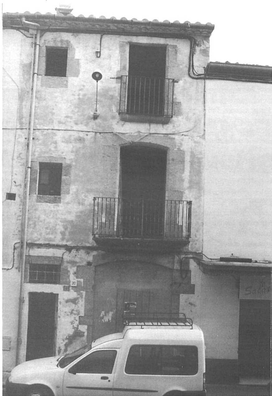
La seu de la redacció ocupava el primer pis d'aquest immoble, on hi ha el balcó.

La revista es dividia en seccions, encara que cada número no tenia el mateix tractament. Així, hi havia les seccions de cinema, la científica, l'esportiva, la radiofònica, la de reportatges, la romàntica..., sense oblidar un apartat per cartes. I cada secció comptava amb un especialista, que utilitzava un pseudònim. Trobem Nancy de Kanty ( star de cinema jubilada), l' speaker Philips; Joe Mac-Hagum, Nicasi Serrès, Kompte Dhius i l'Esparrucac del Barri (expallasso de circ). Els reporters parlaven de tot i de tothom. Fins i tot de la censura. En set números apareix «Visat per la censura».