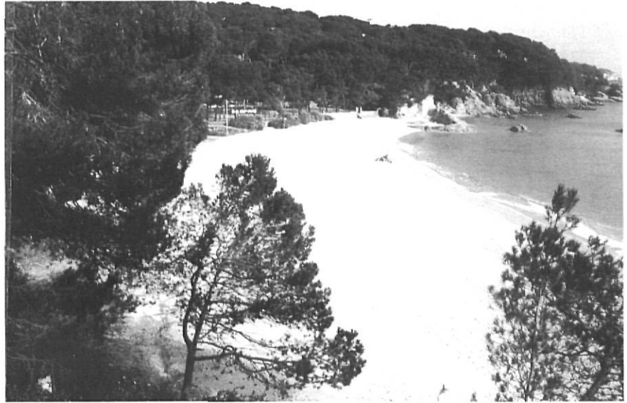
La cala Cristus entre Torre Valentina i Platja d'Aro.

Acabada la guerra, un grup de calongins, entre els quals hi havia els que havien tirat endavant La Xispa , van decidir, després de l'estiu de 1939, editar un diari local quinzenal, amb el nom de Buen Humor . Aquesta nova edició, segons els seus idearis, es