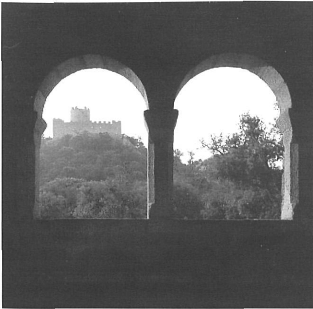
El castell de Famers des de l'atri de l'ermita.

Llorens, arqueòleg del Centre d'Investigacions Arqueològiques de Girona, els anys 1991 i 1992, per determinar les fases d'activitat de la fortificació i la compartimentació de l'espai interior del recinte. A partir dels resultats obtinguts, l'arquitecte del Departament de Cultura, Ramon Castells, va procedir a elaborar el projecte, amb el qual tres anys després es van començar les obres. Aquest, com ja és norma en el seu autor, ha tingut un rigorós respecte per la construcció medieval, que s'oposa completament al d'algunes restauracions de forta influència romàntica que fins no fa gaires anys encara s'han realitzat al nostre