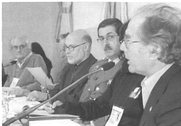
Adolfo Pérez Esquivel, a la dreta, durant la seva intervenció a Figueres

noves regles de joc mundials alternatives.