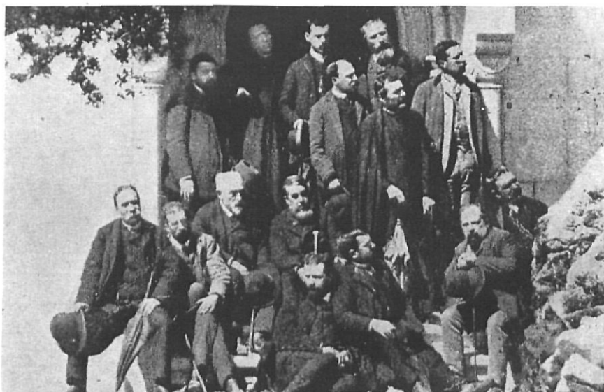
Verdaguer (segon per la dreta a la filera de dalt) durant una estada a l'illa de Mallorca.