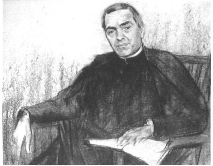
Joan Maragall i Jacint Verdaguer dibuixats al carbó per Ramon Casas.