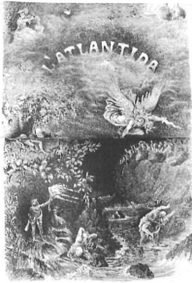
Dibuix d'Antoni Vilanova publicat a La Lluminera de Nova York , l'any 1878.