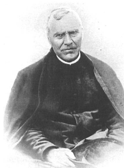
Última fotografia de Verdaguer a Barcelona, l'any 1902.

que en el conflicte Verdaguer-Mor-gades hi ha més que un simple afer de sagristies: hi ha concepcions pastorals enfrontades, hi ha per part de Verdaguer una decisió d'allunyar-se dels rics i acostar-se als pobres, hi ha l'opció per unes formes de vida més fidels a l'evangeli... Però el distanciament de Verdaguer respecte a l'Església de la seva època no va més enllà: Verdaguer no qüestiona en cap moment l'ideari catòlic heretat sinó que s'hi manté fidel tota la vida. És més: al moment de la crisi exalta les idees catòliques dominants amb més força que mai. La negació de la vida present, amb exaltació del sofriment inclosa, per tal de guanyar-se el cel és present a tota l'obra de Verdaguer i s'aguditza precisament a Flors del Calvari , el recull poètic escrit en plena crisi.(18)