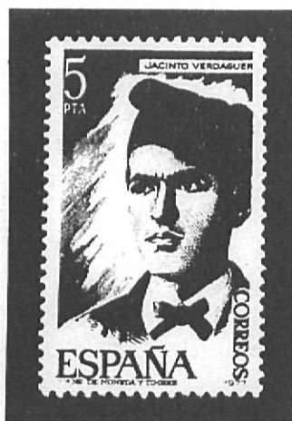
Segell espanyol dedicat a Verdaguer, l'any 1977.