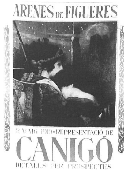
Cartells anunciadors de Canigó a Figueres d'una representació frustrada per la tramuntana, l'any 1910.