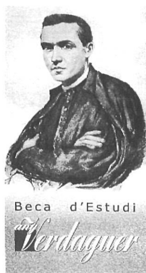
Iniciatives cultural sota l'advocació de Verdaguer, el 1947 i el 2002.

de la Pica d'Estats, el 25 d'agost de 1983, un poema de Miquel Martí i Pol dedicat a Jacint Verdaguer.