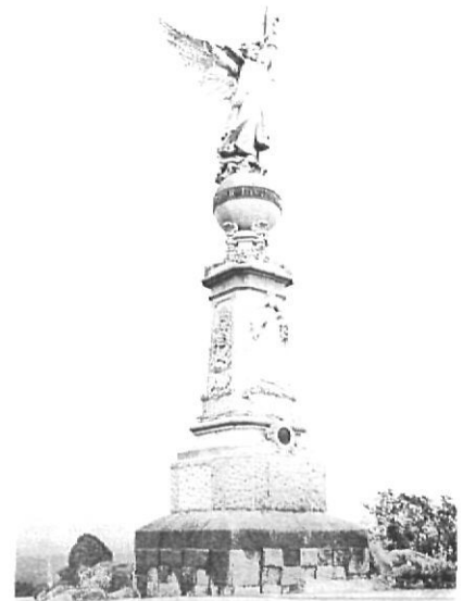
El monument de l'Àngel de Lloret de Mar, de 1904, primer dels erigits en memòria de Verdaguier a Catalunya.

record de Banyoles vers el poeta amb la inauguració d'una nova Font de la Filadora al paratge dels desmais, a tocar de l'estany. Es tracta d'una escultura de formes rectilínies obra de Carme Pujol on es reproduceix el poema al·lusiú a la ciutat que mossèn Cinto va incloure a Canigó .