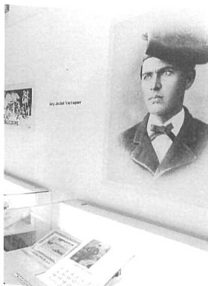
Exposició filatèlica a Girona.