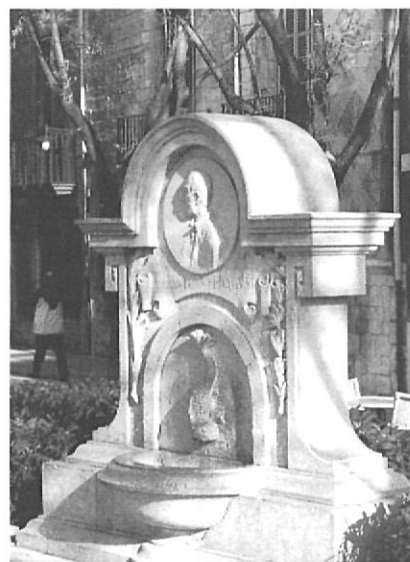
Font dedicada a Verdaguer, a Girona.

(1.845 - 1902) Poeta que significó el renacimiento de la literatura catalana. Entre muchas otras, destacan sus poemas "L'Atlàntida", "Ídil - lris i cants místics", "Oda a Barcelona", "Canigó", "Flors de Calvari" etc.