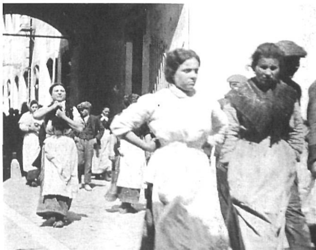
Sortida de les treballadores de l'antiga fàbrica Coma i Cros.

Es tracta d'edificis que no són antics (final del segle XIX, principi del XX), són funcionals i amb una estructura resistent (van ser dissenyats per suportar pesos i vibracions), per la qual cosa es poden reutilitzar. Bona part no són bonics en el sentit estètic d'obra d'art, però un cop recuperats adquireixen un caràcter singular que els converteix en emblemàtics.