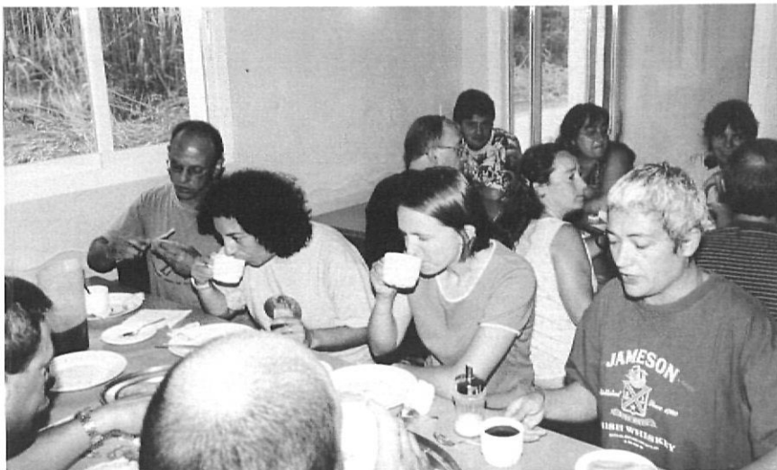
Escola-família: colònies amb pares i mares.

Aquest sistema de treball parteix de l'interès dels alumnes sobre algun tema, tal i com apunten diferents pedagogs,