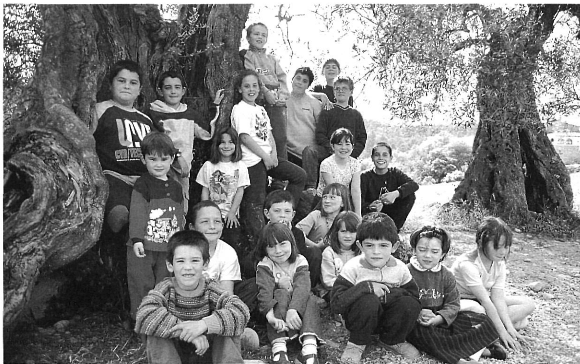
Els alumnes del CEIP Santa Cecília de Boadella.

La segona fase va ser repartir-nos en grups les diferents noves feines: buscar informació, contactar amb Medi Ambient per sol·licitar-los material, preparar els tríptics, elaborar un audiovisual i preparar el contingut de la xerrada.