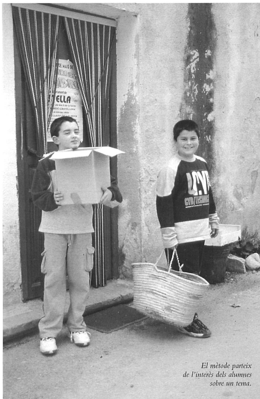
El mètode parteix de l'interès dels alumnes sobre un tema.