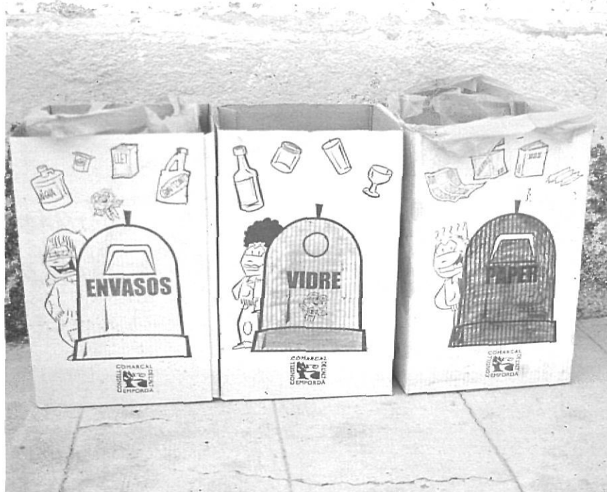
Contenidors per a la recollida selectiva.

— Qui farà cada cosa? (divisió del treball; treball en equip)