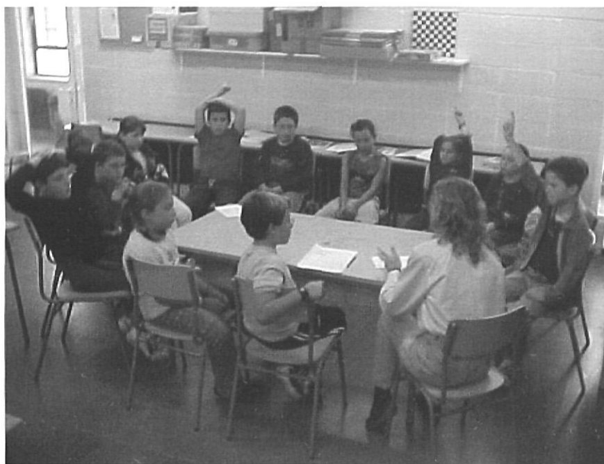
Alumnes de 4t feint assemblea de classe.

El procés que es segueix està en constant evolució i depèn, en gran mesura, de les capacitats inherents a l'edat de cada grup d'alumnes. A grans trets, pre-