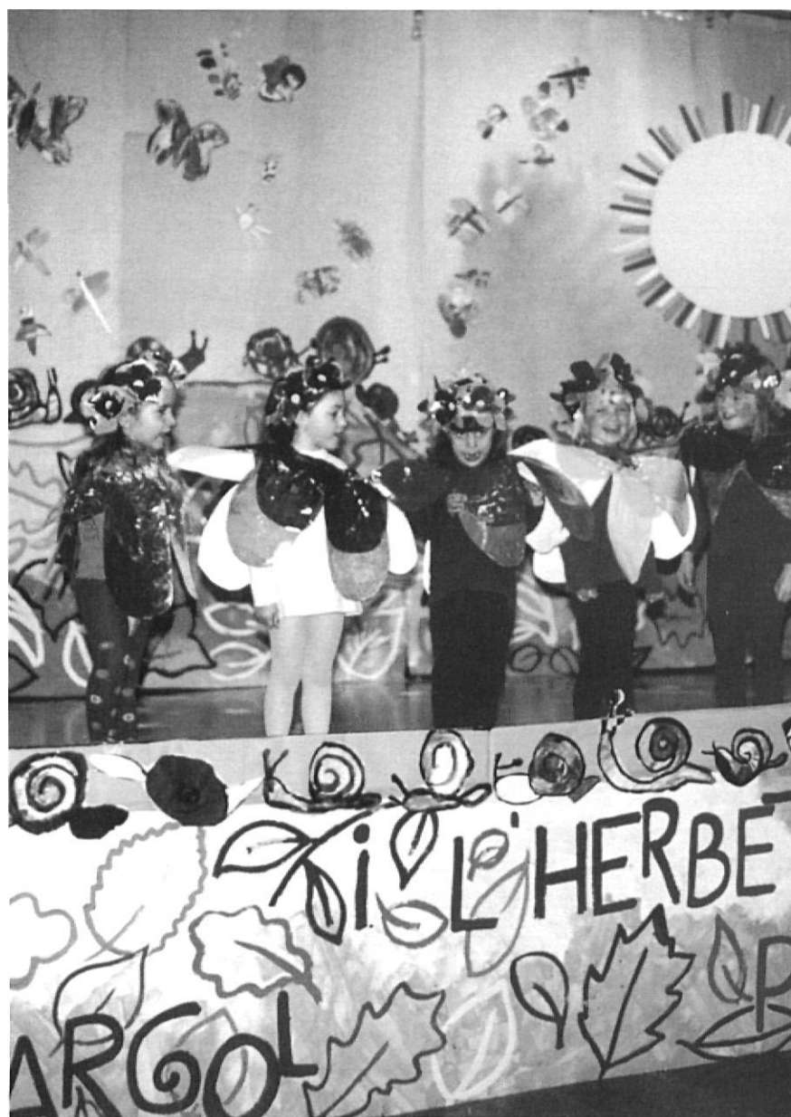
Alumnes de P4 fent la representació El cargol i l'herbeta de poliòl.