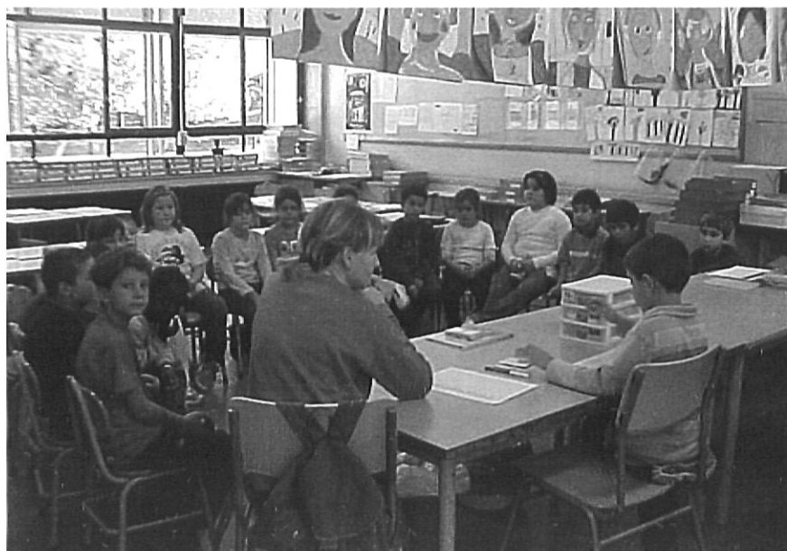
Una assemblea de classe a cicle inicial.

mentària tipus «taller» impartida per un monitor, extern al grup classe, en la qual hi participen els alumnes que volen. Es tracta d'una activitat en què participen tots els alumnes i de la qual se n'espera que faciliti de manera significativa tot un extens conjunt d'aprenentatges (continguts procedimentals, conceptuals i actitudinals) propis de la funció educativa escolar.