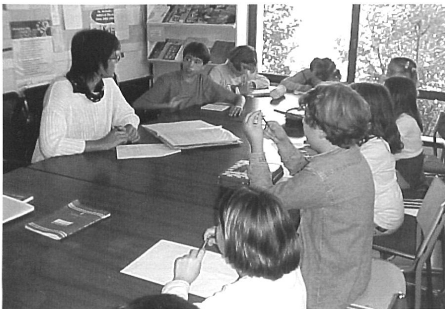
Reunió de delegats i delegades de l'Aulet.

– A cicle inicial (6, 7 anys) les assemblees ja formen part de l'horari setmanal. S'hi intenta resoldre conflictes quotidians i es procura que siguin els mateixos alumnes els que proposin un model de comportament adequat. Així mateix, se'ls convida que expressin lliurement els seus interessos i les seves percepcions sobre el funcionament del curs, l'organització de la classe... És també en el marc de l'assemblea de classe on té lloc la presentació de propostes i la tria definitiva dels projectes d'estudi que el grup classe realitzarà. Pel que fa als aspectes metodològics, cal destacar la figura del delegat/da de classe, amb les funcions, entre d'altres, de garantir la connexió de l'assemblea de classe amb l'assemblea general a través de les reunions de delegats.