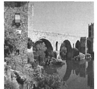
El pont de Besalú