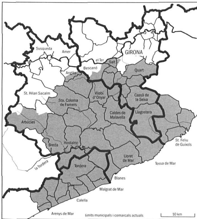
Ardiacaonat de la Selva.