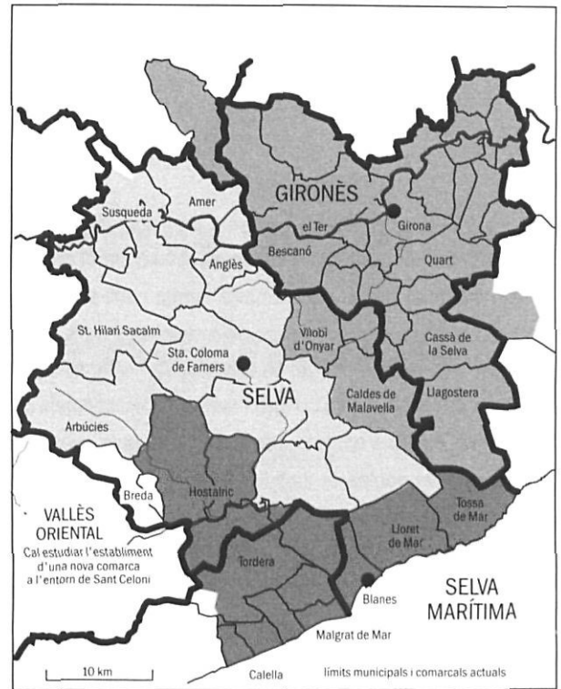
Informe sobre la revisió del model d'organització territorial de Catalunya (2001).

la consideració dels pobles que podrien haver-hi estat interessats. En fer públiques les propostes de la Ponència, Pau Vila resumia així les discussions entorn de la comarca de la Selva: «la Ponència s'inclinà de primer antuvi a refundre els dos partits de Santa Coloma i Girona en una sola demarcació: és que geogràficament cap divisòria natural no separa les dues demarcacions Selva i Gironès; i la xarxa de carreteres permet en general una ràpida comunicació dels pobles amb Girona. Una informació recollida, en viatge d'estudi, palesà d'una banda l'interès raonable de Santa Coloma a conservar una capitalitat, a la qual ha lligat algunes de les seves activitats, i d'altra banda la bona disposició dels pobles consultats envers Santa Coloma, ja que, o bé es mostren partidaris de conservar l' statu quo , o no manifesten gran desig de modificar-lo. Deixant-ho així, la comparació de la demarcació amb l'actual partit de Santa Coloma mostra una coincidència gairebé completa». Del cas de Blanes es diu que «els elements representatius proposaren que hom els constituís una circumscripció pròpia [...] però com sigui que aquesta rogalia hauria resultat migrada en relació amb la densitat de població, la Ponència es veié també en el cas de no poder acollir la idea. Consigna tanmateix la raonada aspiració d'una vila creixent i pròspera, per si algun dia li pot ésser atorgat algun servei adient a les seves activitats i a la seva importància».