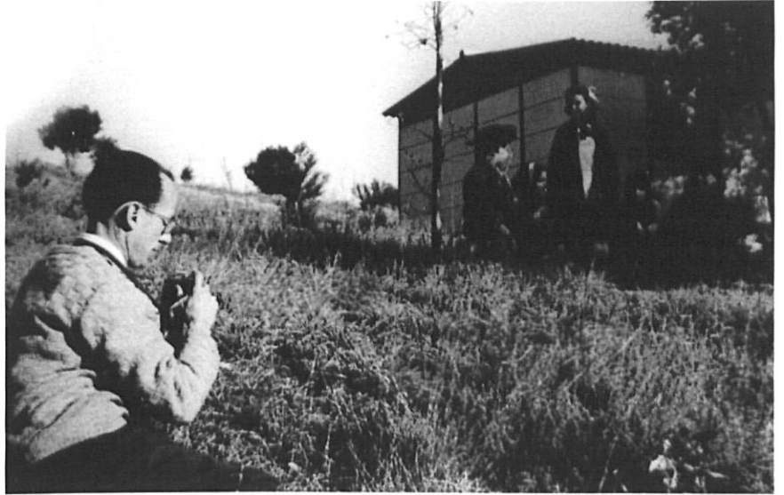
D'excursió, fent una foto a la família.

Tenia una preparació amb tota solvència. Traient hores d'on fos es va aplicar a les classes de llengua durant els quatre primers cursos del que en el seu inici no era més que una delegació de la facultat de lletres de la Universitat Autònoma de Barcelona. Quan ja hi hagué possibilitat de comptar amb professors de dedicació exclusiva, ell, voluntàriament, es