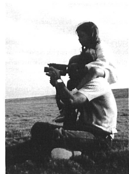
Als plans de les Salines, l'any 1984.

La direcció li pesava. Eren temps en què aquestes responsabilitats resultaven molt compromeses. Compre-