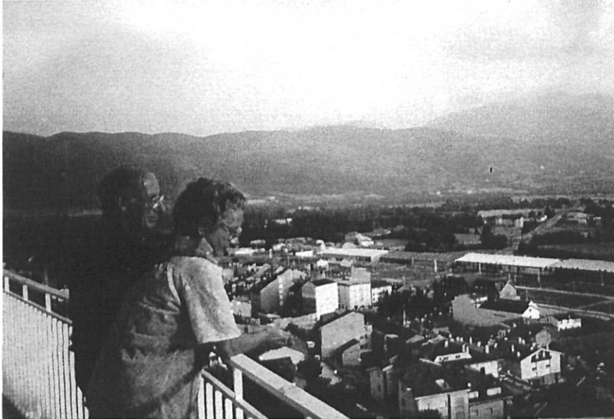
A Puigcerdà, l'any 1995.

un treball que l'omplia i el satisfieia. Però a vegades la llei és taxativa i inexorable.