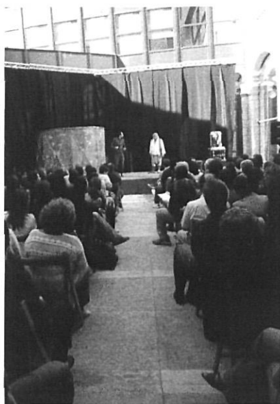
Espectacle al pati de la Diputació.

Aquest tercer FITAG ha destacat sobretot per dues coses: en primer lloc, pel bon ambient que hi havia entre els membres de les companyies participants, originàries de llocs tan diferents com ara Rússia, Turquia, Alemanya, Portugal, França, Itàlia, Hongria i diverses comunitats de l'Estat espanyol. Aquests autèntics apassionats del teatre, que s'hi dediquen en cos i ànima a canvi de poc o res, van gaudir a Girona d'espais com ara la residència Bisbe Cartanyà –on dormien– i La Planeta –un dels principals escenaris i punts de trobada del festival–, on van poder compartir experiències, projectes i, per què no, una mica de farra , en un ambient de gran companyonia. En segon lloc, el FITAG 2002 no ha estat en absolut un festival tancat, només reservat als iniciats, sinó que ha obert les seves portes a tota la ciutat, amb teatre i música al carrer, i entrada lliure i gratuïta a tots els espectacles que van tenir