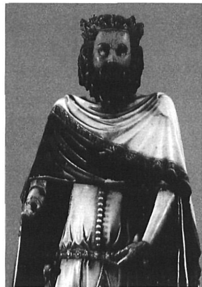
El «Sant Carlemany» de la Catedral.

La mostra, amb uns excel·lents recursos visuals i amb una infografia