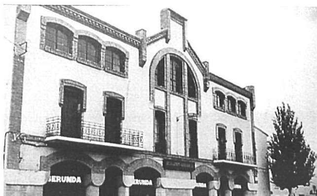
Destil·leria Genuda (Girona)