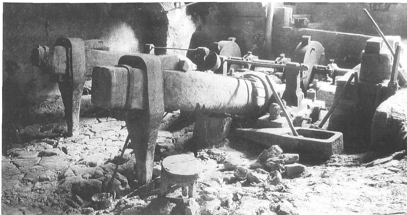
Les fargues del Ripollès van produir ferro fins ben entrat el segle XIX.

comarques de Girona on encara se'n poden trobar interessants vestigis, tant pel seu nombre com pel seu estat de conservació.