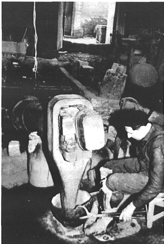
Martinet d'aram de la farga Palau, a Ripoll.

Finalment, a Setcases, els topònims Pont de la Farga i Hostal de la Farga ens recorden l'existència en aquesta localitat d'una antiga farga de ferro, documentada des del 1626.