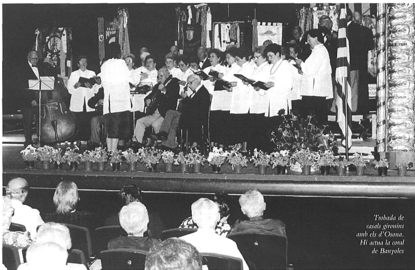
Trobada de casals gironins amb els d'Osona. Hi actua la coral de Banyoles

Si al concepte de diàleg, en sentit ampli, hi afegim el concepte d'intergeneracionalitat, ens trobem amb un ampli ventall de possibilitats, amb un horitzó per explorar.