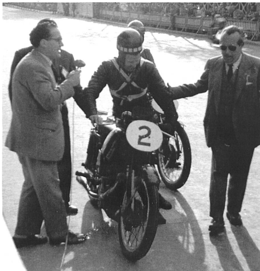
En una retransmissió de les 24 hores de motos de Montjuïc.