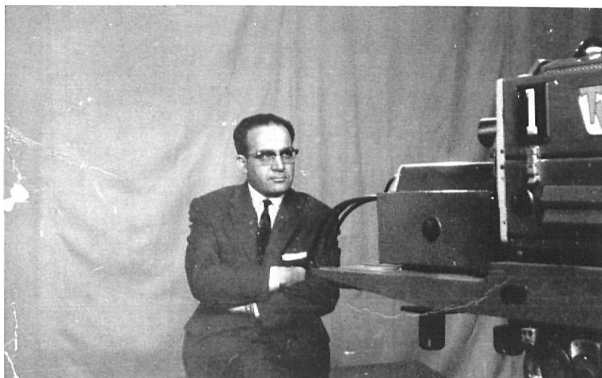
Als estudis de Televisió Espanyola a Miramar.