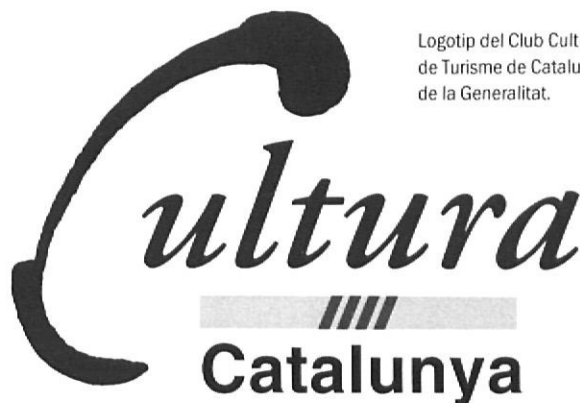
Logotip del Club Cultura de Turisme de Catalunya de la Generalitat.