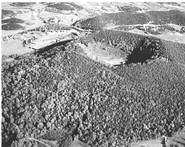
El volcà de Santa Margarida, a la Garrotxa.

inesborrable. Per això no tan sols la geografia física determina la seva diferenciació, sinó que sovint són els usos del territori els que permeten distingir unes àrees de les altres. La lectura econòmica de l'espai demostra que coexisteixen models, realitats i tipologies d'activitat ben distintes, amb delimitació de regions amb predomini d'usos forestals, agraris, industrials o de serveis, que es corresponen a grans trets amb les regions turístiques delimitades per la Generalitat de Catalunya.