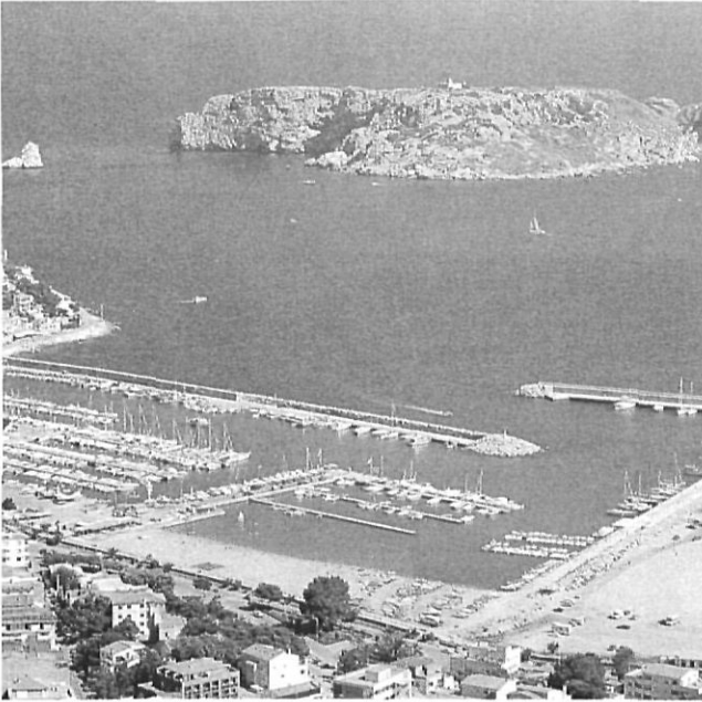
L'Estartit i les Medes, al Baix Empordà.

esperona la integració de les creacions artístiques tradicionals en les noves construccions; potencia la gastronomia local en l'oferta de restauració; millora els accessos a la zona per facilitar la posada en valor del patrimoni cultural; i impulsa la recuperació de tradicions del món rural com a manifestacions culturals, que són de vital importància per garantir la sostenibilitat del desenvolupament turístic.