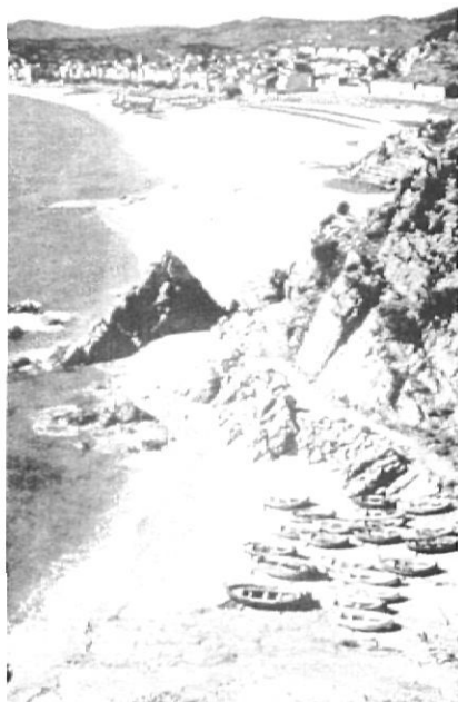
Lloret des de sa Caleta, a començament del segle XX.

mitjans audiovisuals i per la presència de les troballes arqueològiques més significatives de la Peralada medieval.