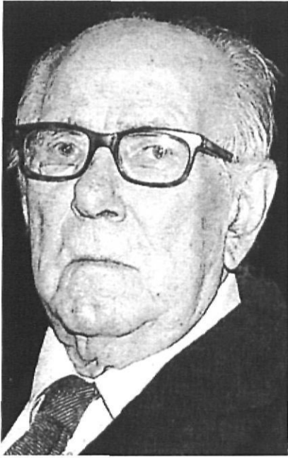
Xavier Montsalvatge (Girona, 1912).