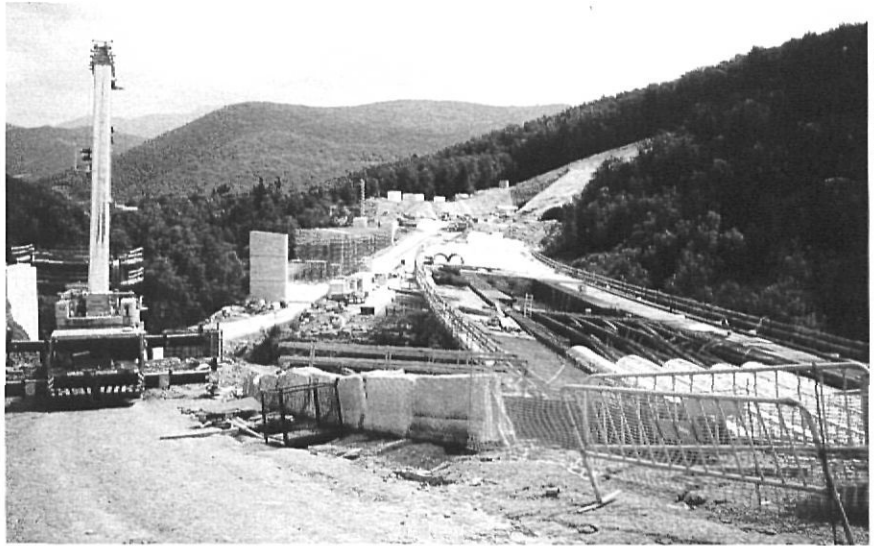
Obres de construcció de la variant de Castellfollit de la Roca.

— No s'aplica en absolut un principi bàsic de sostenibilitat com és, davant d'una necessitat viària, escollir l'opció que causa menys impacte i que requereix menys ocupació de sòl. La destrucció totalment gratuïta i innecessària de fèrtils sòls agrícoles al pla de Politger, al pla de les Funoses, al pla de Begudà i a Sant Cosme és una mostra palpable d'actuacions insostenibles dutes a terme dins un espai teòricament protegit, el Parc Natural, i en un moment en