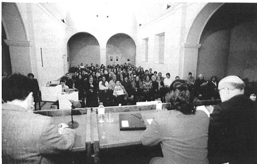
Una sessió de les Jornades de Salt.