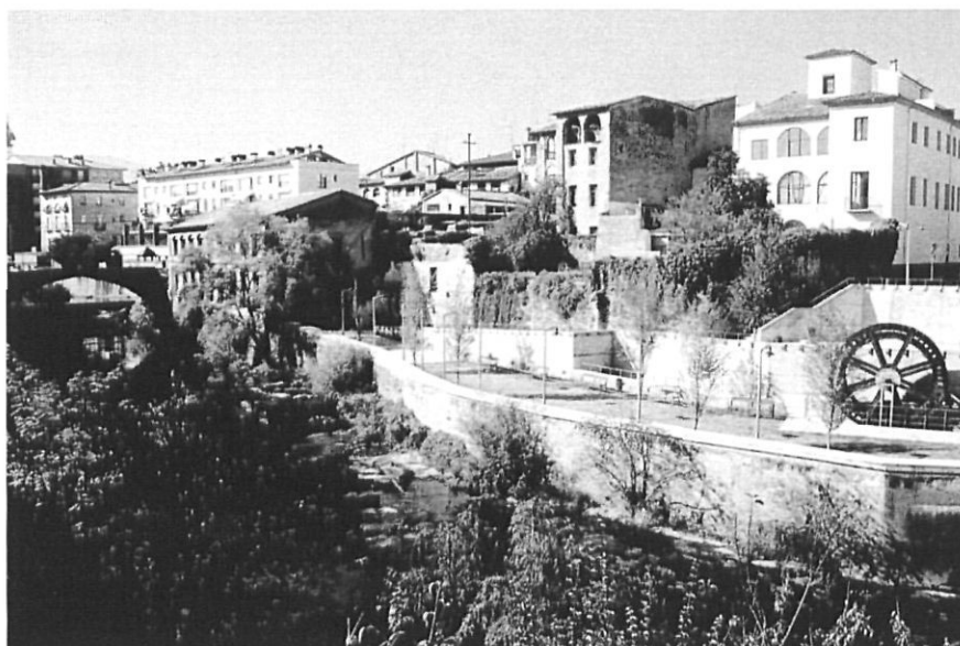
El Fluvià des del pont del Palau. A primer terme, el passeig i la sínia hidràulica.