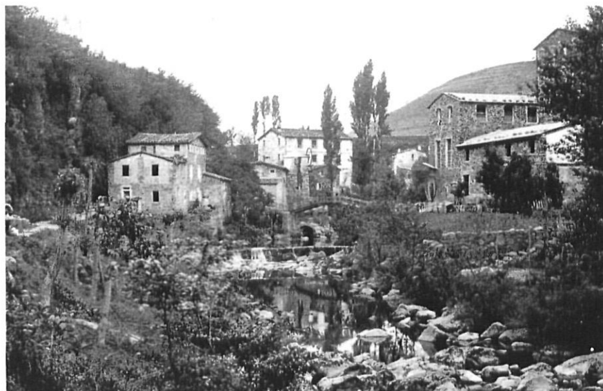
Paisatge industrial a la Canya. Can Gabarró, Can Sabata, el barri de Triana, el pont... c.1910

Aquí podem veure els basalts, la resclosa i les restes d’antics forats per a la primitiva de fusta o per a un pont, el naixement del canal i les diferents indústries encara situades al costat del Fluvià: Ca l’Artigues, antiga fàbrica de tint i seu de la magna Exposició regional olotina de Belles Arts i Indústries de 1900; Can Masllorrens, que ja feia barretines el 1730, igual que Ca l’Aubert, dit Can Jonvi; Cal Rusclaire, de nom ben evocador de les blanqueries; o l’antic edifici de la primera experiència cooperativa tèxtil a Olot (la Cooperació Fabril, de l’any 1900),