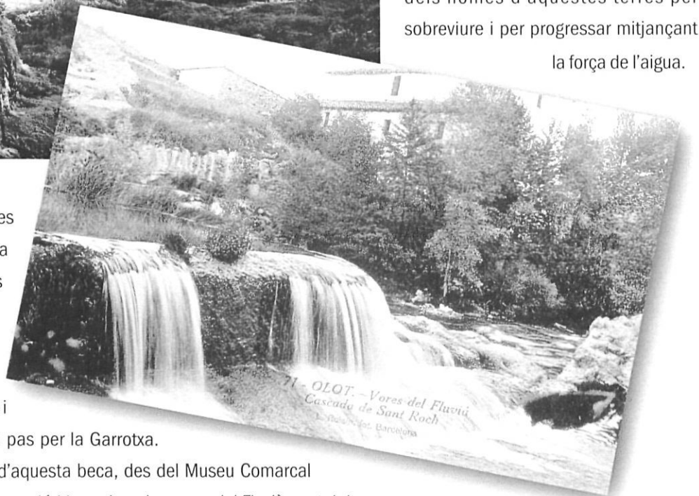
La resclosa i el molí de Sant Roc, avui i en una imatge de c. 1915.

Coincidint amb la presentació d'aquesta beca, des del Museu Comarcal de la Garrotxa s'organitzà una excursió-itinerari per les vores del Fluvià per tal de visitar allò que ens queda d'arqueologia industrial: les ja escasses restes del