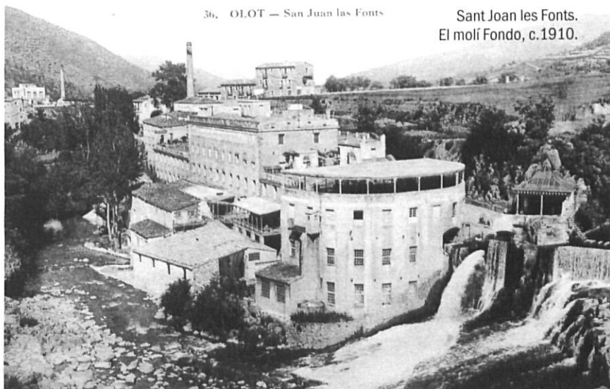
36. OLOT — San Juan las Fonts

A la zona de Sant Joan s'establí doncs la més gran concentració de molins paperers del Fluvià. El paper a mà innovat el segle XVIII per la introducció de la pila holandesa rebé, però, un cop mortal arran de les convulsions socials (recordem que fins a la Guerra Civil Sant Joan fou una vila de tradició llibertària) de final del segle XIX. El molí Fondo es transformà en la fàbrica de La Reformada o d'en Capdevila el 1723, al lloc on ja hi havia un vell molí. Al principi va estar dedicada a la producció de paper de fumar, i posteriorment de paper fi, fins al 1921, en