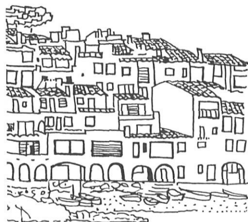
CALELLA DE PALAFRUGELL