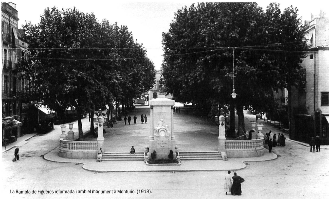
La Rambla de Figueres reformada i amb el monument a Monturiol (1918).