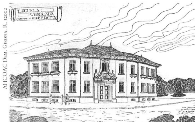
Escola Ramon Turró a Col·legi Verd (1929). Girona. Perspectiva de les façanes al xamfrà.

En relació amb el primer, i malgrat la gran distància respecte del llenguatge del Palau d'Arts Gràfiques de Duran i Pelayo Martínez i del Palau d'Agricultura de Mayol-Ribas i les obres més radicalment neobrunellesquianes de Rubió i Tudurí, cal entendre la proposta de la casa Bellamar (Masnou, 1927) per al patrici dels republicans federals figuerencs Joaquim Cusi i Fortunet, i també els ecos més esmorteïts del mateix llenguatge en els Laboratorios del Norte de España (Masnou, 1927), de la mateixa família. I fins i tot podem situar en aquesta òrbita el Col·legi Verd de Girona (1927), malgrat que es manté molt vinculat a les escoles de Goday.