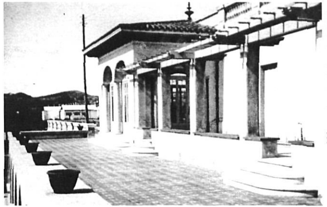
AHCOCAC/DEM. GIRONA. R. 1999

La seva obra en aquesta etapa —escola Ignasi Iglesias a Montjuïc (1931), projecte de mercat en l'illa dels carrers Tints, Peralada, corriol de les Bruixes i plaça de les Patates a Figueres (1933), projecte d'escola al carrer Mariana Pineda de Figueres (1933), escoles de Sant Hilari Sacalm (1934) i grup escolar Prat de la Riba de Girona (1937)— està més en sintonia amb l'Antoni Puig Gairalt de la fàbrica Myrurgia (1928), amb el Folguera de la casa Sala del Llorà (1930), amb el Goday de l'escola Collasso (1931) i amb el Mestres Fossas de l'escola Blanquerna (1931) que no pas amb l'avantguarda ortodoxa del GATCPAC.