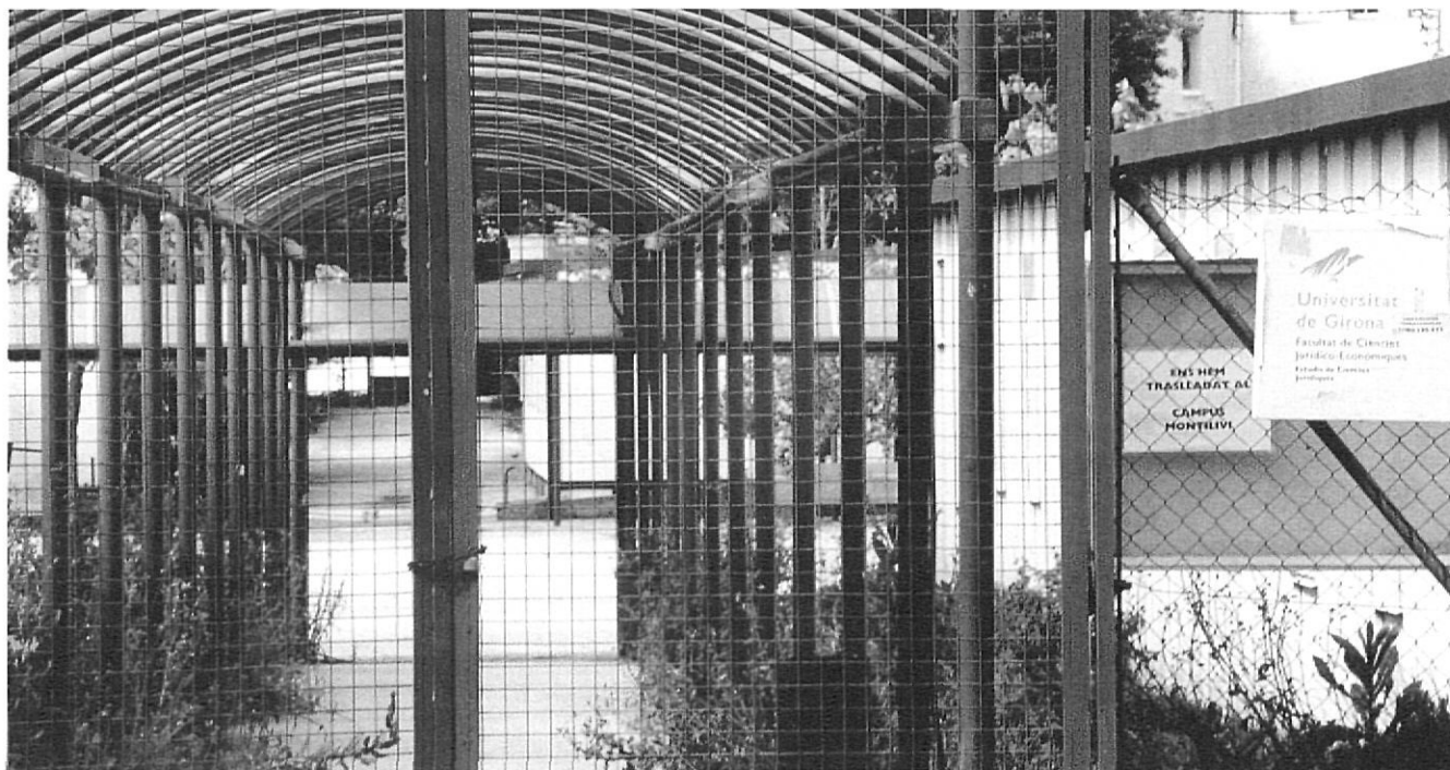
El Pont / MIKEL LABRÓ