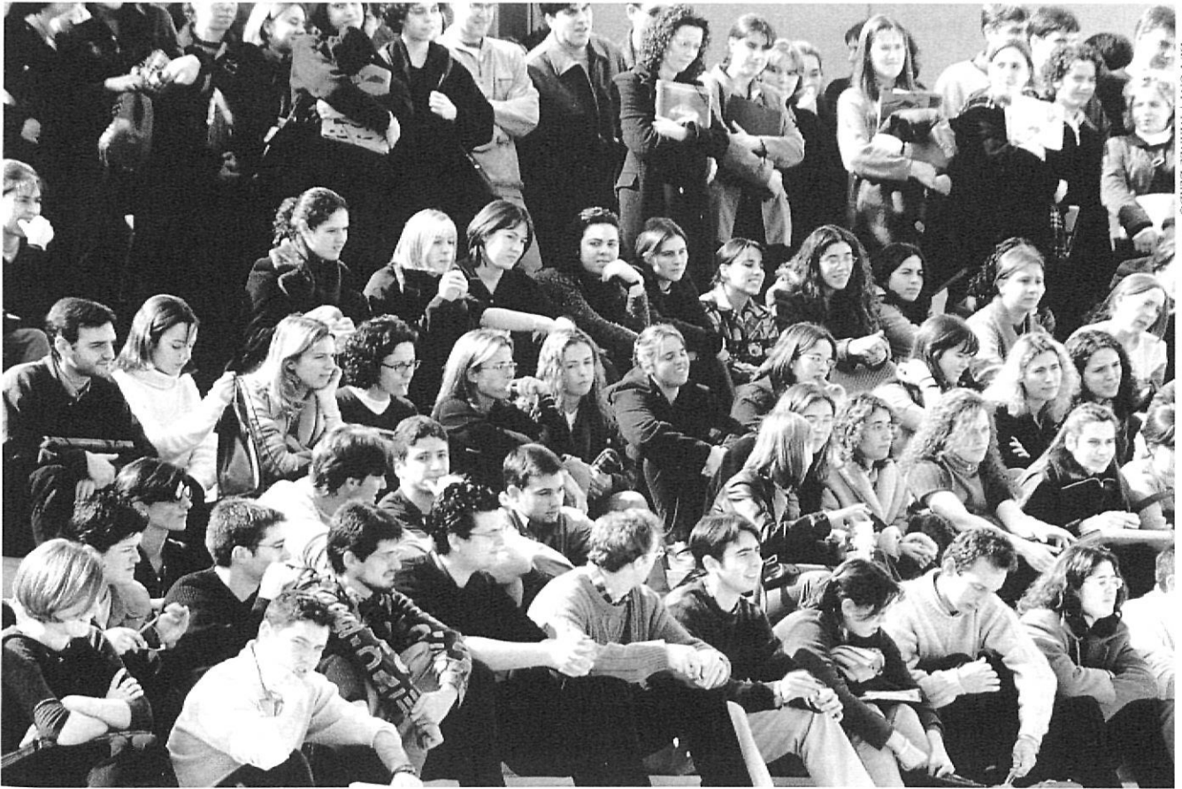
El Pont / MARIU LLADO