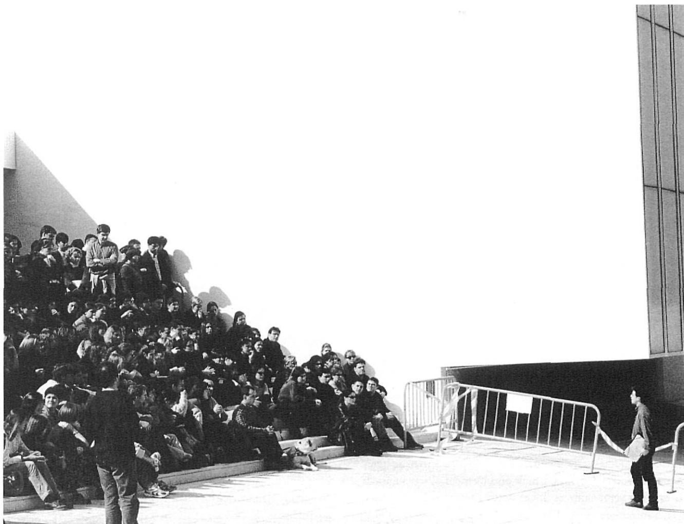
Ei Punt / MANEL LLADÓ