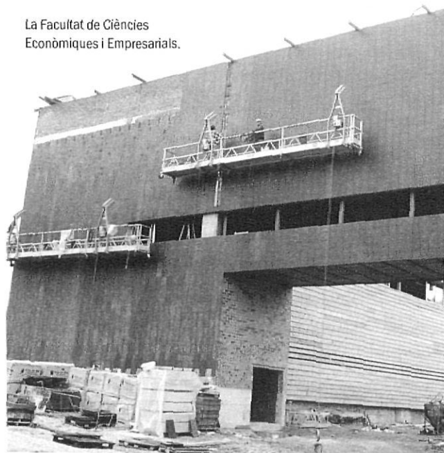
El Pont / LUTIS SERRAT