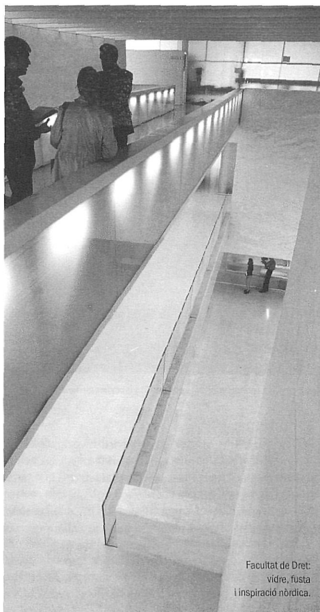
El Pont / MARI LLAJÓ

La cronologia de les cessions és la següent: