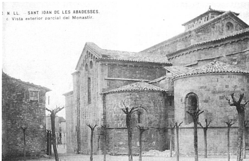
M. LL. — SANT JOAN DE LES ABADESSES. d. Vista exterior parcial del Monestir.

L'abundosa correspondència entre Puig i Masdeu permet de fer-se una idea clara de la implicació de l'arquitecte en la restauració del monestir: seguia amb cura cada intervenció i, amb les seves instruccions detallades i precises, encaminava i solucionava tots els aspectes de les obres. Sovint hi patia, i es