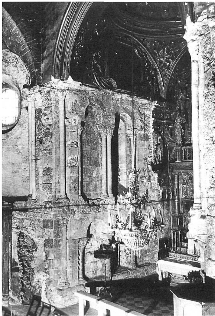
Aparell decoratiu romànic de l'absis central aparegut a Sant Joan de les Abadeses durant la restauració de Puig i Cadafalch.

reconstruir Ripoll volia dir retrobar un signe bàsic de la nació catalana. I el país sencer s'abocà a prendre part en aquesta tasca.