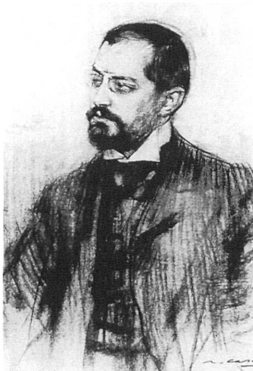
Puig i Cadafalch, en un dibuix de Ramon Casas.

Una vegada enllestides les reformes i construccions exteriors, es prosseguí per l'interior, on es va extreure tot l'enguixat que cobria les parets del temple. A la zona del cambril barroc van aparèixer les arcuacions de l'absis central i dos notables finestrals, elements que havien quedat amagats per la construcció de l'esmentat cambril durant el segle XVIII. Fou una descoberta unànimement celebrada, ja que proporcionava la pauta a seguir per a la restitució de gran part de la decoració que calia executar. Tanmateix, Puig atacava una zona molt delicada, litúrgicament parlant: el cambril contenia el grup del Davallament del Santíssim Misteri, el qual era objecte de constants veneracions. El 1936 es perdé la sagrada forma incorrupta que contenia la testa del Crist, amb la qual cosa es perdé tot allò de sagrat que tenia el Davallament. Malgrat que ens pugui doldre,