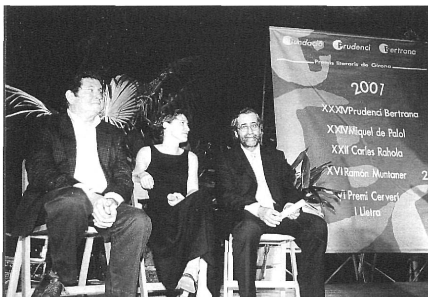
Aquí i a la pàgina anterior, diversos moments de la festa de proclamació dels Premis Literaris de Girona.

conduir una cerimònia que al principi va ser lenta, amb moltes intervencions, i que es va agilitzar al final. La gent que seguia l'acte va trobar a faltar allò que és norma una nit d'estiu a la Devesa: tenir un got a les mans. El sopar, servit a la barra, va ajudar a donar al premi el to popular buscat. El nou escenari