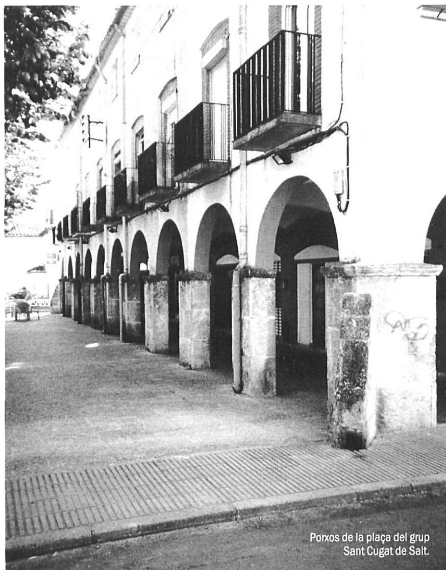
Porxos de la plaça del grup Sant Cugat de Salt.