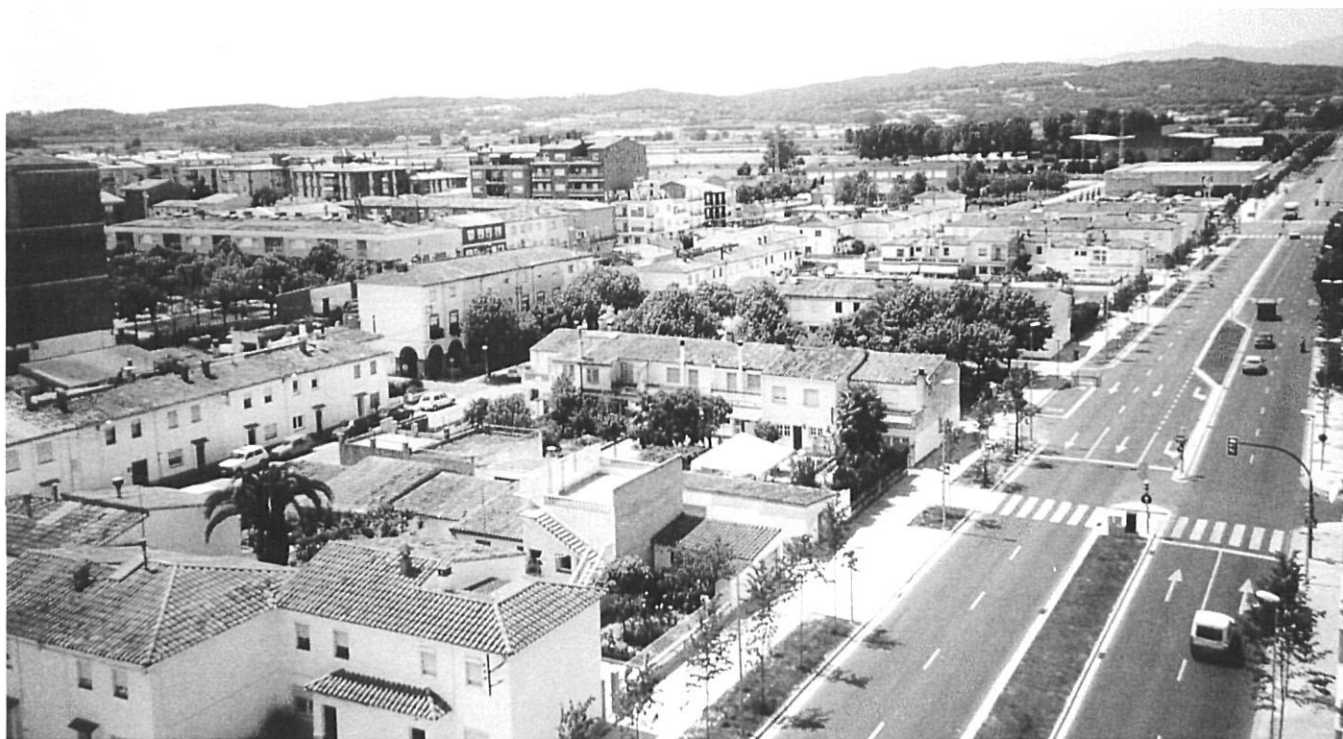
Una estructura de vuit illes d'edificis, a banda i banda de la plaça enjardinada.

soterrat i amb accés per l'hort... són exemples prou paradigmàtics que expliquen la permissivitat de la mateixa OSH perquè les cases més modestes (39,2m 2 i 47,6 m 2 ) poguessin edificar fins als 56 m 2 . Com que això era insuficient, però, les densitats edificades van créixer sense ordre ni restriccions.