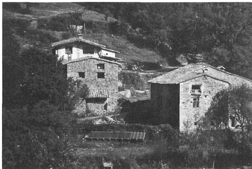
La masia del Molladar (s. XV), a la vall de Salarça, s'ha reconvertit en un allotjament turístic. En primer terme s'hi observen les plaques solars, que poden ser una bona solució per al subministrament elèctric en els indrets més inaccessibles.

estat ni adequades ni respectuoses amb els valors naturals i culturals de la zona, actualment protegida pel Pla d'Espais d'Interès Natural (PEIN) i per les posteriors Normes de Protecció.