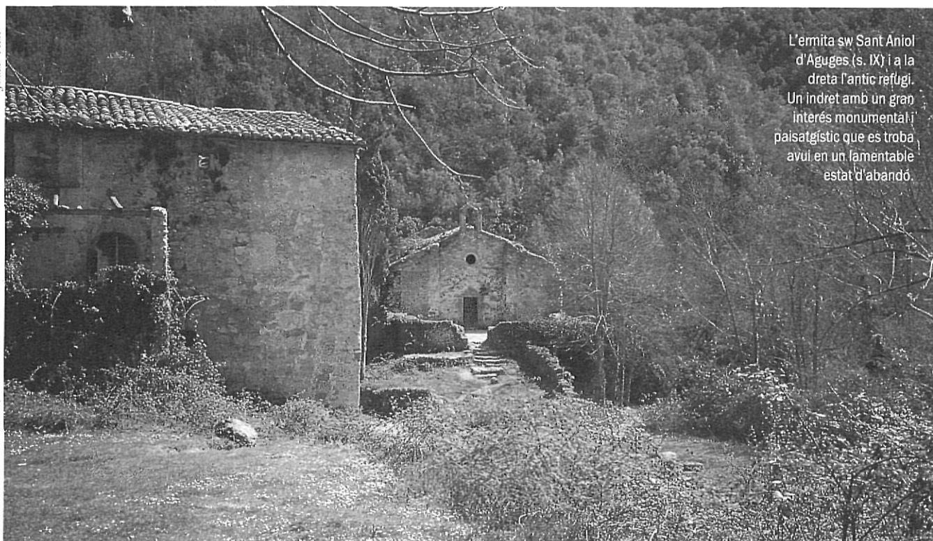
L'ermita sw Sant Aniol d'Aguges (s. IX) i a la dreta l'antic refugi. Un indret amb un gran interès monumental i paisatgístic que es troba avui en un lamentable estat d'abandó.

• Promoure un model propi de gestió forestal, amb l'objectiu de permetre, a tots els llocs on sigui possible, una progressiva reorientació dels boscos de rebrot, especialment als alzinars, cap a boscos de peu, a partir d'una selecció de rebrots. Aquestes intervencions permetrien crear llocs de treball, i afavorir una adequada regeneració d'aquests boscos tan densos, desequilibrats i vulnerables. També seria interessant que els més ben conservats i situats en els indrets més inaccessibles es conservessin sense intervenció, per deixar-los evolucionar cap a esplèndids boscos madurs, que tan rars són al nostre país. En aquest sentit caldrien aportacions dels poders públics i de fundacions privades, via adquisició del sòl, dels drets de tala o per mitjà de convenis de col·laboració.