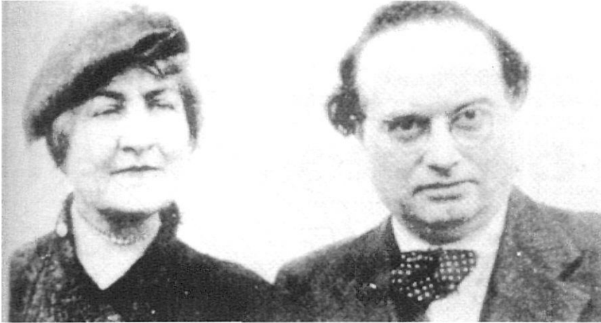
Alma Mahler i Franz Werfel, a França, el 1940. La fugida pels Pirineus del seu grup es va endarrerir perquè Alma no havia trobat una maleta apropiada on guardar-hi els seus nombrosos barrets.

port, tot i que l'associació va mantenir encara les seves activitats fins al 2 de juny de 1942. Un cop convertit ell mateix en un indocumentat, Fry no va tenir més remei que tornar als Estats Units, on va reprendre la seva existència monòtona com a professor de llengües clàssiques, llengües mortes; va reprendre aquella vida discreta que havia menat abans de l'estada a Marsella, amb la diferència que ara tenia fitxa oberta als arxius d'individus suspectes de l'FBI. El seu gran error havia estat creure que una operació d'aquella envergadura, auspiciada per un govern que aleshores es considerava neutral, hagués estat planejada amb fins exclusivament filantròpics. Fry va convertir-se en un titella molest quan va estendre l'ajuda que els Estats Units avalava a un tipus de gent que ja no convenia, però quan va arribar el moment de desmantellar la parada d'aquell idealista inoportú, la feina ja estava feta: els americans ja s'havien endut d'Europa les llavors de la seva imminent hegemonia cultural;