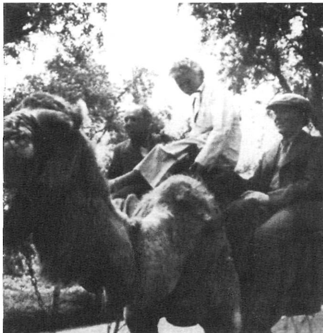
Benjamin Péret, Jacqueline Lamba i André Breton, de vacances a Canàries, el 1934. El març de 1941 tots tres embarcaren a Marsella en un vaixell en direcció a la Martinica, on s'estaren un mes abans de partir als Estats Units.