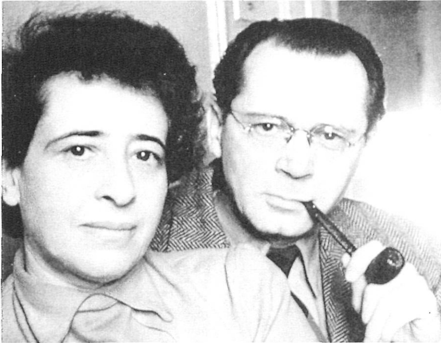
Hannah Arendt i Heinrich Blücher, als Estats Units, el 1950. Benjamín va confiar al matrimoni el manuscrit de les Tesis sobre la filosofia de la història poc abans d'iniciar la travessia pels Pirineus.

que no podien aportar res per mercadejar-hi, explica que aviat va comprendre que allò que interessava el seu govern era el negoci («the business of my government was business»). No obstant això, la identitat dels responsables d'aquella selecció que va fer que el govern transgredís les seves pròpies lleis d'immigració no és del tot clara. Sovint s'ha atribuït a Peggy Guggenheim, Thomas Mann i Jules Romains, però també als representants de l'emigració centreeuropea que ja eren instal·lats als Estats Units i que desitjaven sobretot salvar activistes polítics. El director del Museu d'Art Modern de Nova York, Alfred H. Barr Jr, i la New School for Social Research van afegir-hi també els seus noms. Era una llista de moltes mans, de molt diversos interessos.