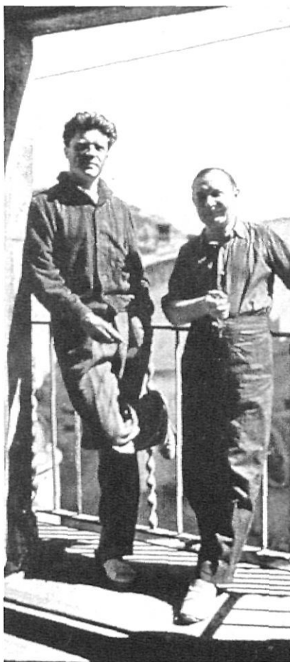
El crític d'art Georges Duthuit i el pintor André Masson, al balcó de la casa que l'artista tenia llogada davant la Vila Vella de Tossa, el 1934.

perquè a partir d'aleshores ja no els caldria creuar l'Atlàntic per trobar la «residència de l'ànima»: ja la tindrien a casa seva.