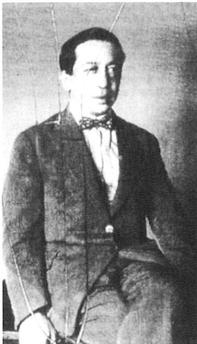
Siegfried Kracauer en una imatge de 1930, tres anys abans que els seus llibres fossin cremats públicament pels nazis.