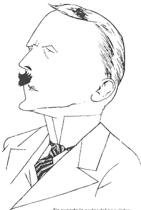
«No suporto la pudor del populatxo». Caricatura de Hitler inclosa en el llibre de dibuixos de George Grosz El rostre de la classe dominant , de 1921.