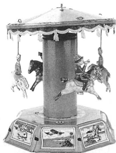
JORDI S. CARRERA

Les juguines s'exposen en sentit cronològic i seguint l'evolució dels materials —de la llauna fins al plàstic—, passant per l'interregne de la postguerra, marcada per la gana, la fusta i el paper cartró. Així, tro-