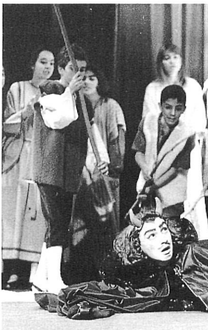
LUIS SERRAT / EL PUNT

Aquests Pastorets són, per dir-ho així, la segona part d'uns altres, amb categoria de mite, que es van fer durant molts anys al teatre del Col·legi La Salle. Sense oblidar el parèntesi que van omplir amb nota els Pastorets nascuts al Teatre de Salt, el fet és que aquest invent de Joan Ribas, renovat any rere any, amb aportacions escèniques innovadores i lligades a l'actualitat a partir d'un text inicial que cada vegada és més difós, ha esdevingut tot un esdeveniment ciutadà. Començant pel caliu que genera i arribant a la singular col·lecció de pòsters que