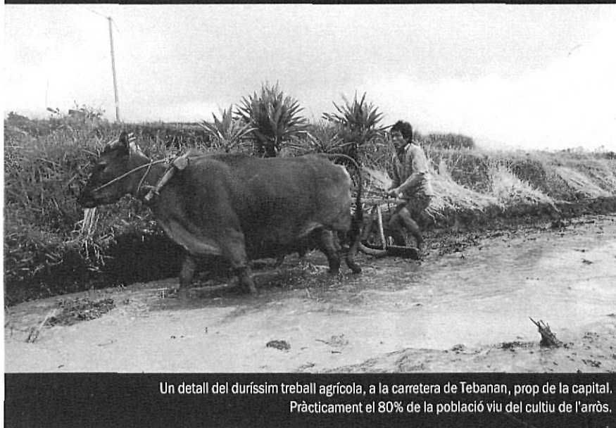
Un detall del duríssim treball agrícola, a la carretera de Tebanan, prop de la capital. Pràcticament el 80% de la població viu del cultiu de l'arròs.