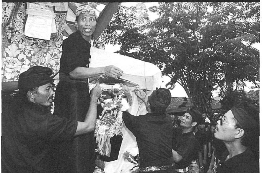
Detalls de la col·locació del fèretre.