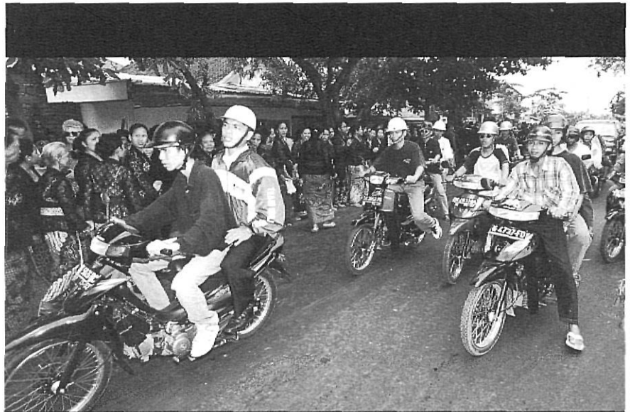
Imatge d'un dels carrers de la capital, Denpasar. La gent es concentra a les voreres per veure el pas d'una processó mortuòria.

Les autoritats calculen que, entre temples, petits monòlits i figures al·legòriques emplaçades per lloar els déus i d'altres construccions, a l'illa podem trobar un total de 13.000 monuments. Estan a qualsevol lloc, en un racó del camí, a l'entrada dels llogarrets, enmig dels boscos impenetrables. En aquesta illa tot, absolutament tot, és religiós, sacre. No us penseu que tots aquests elements són hindús. Al contrari, podeu trobar des de temples construïts fa quatre anys fins a restes que es remunten al neolític. Aquí la religió i les civilitzacions semblen eternes. Se superposen i es barregen. Al costat d'elements neolítics, trobem els recintes característics