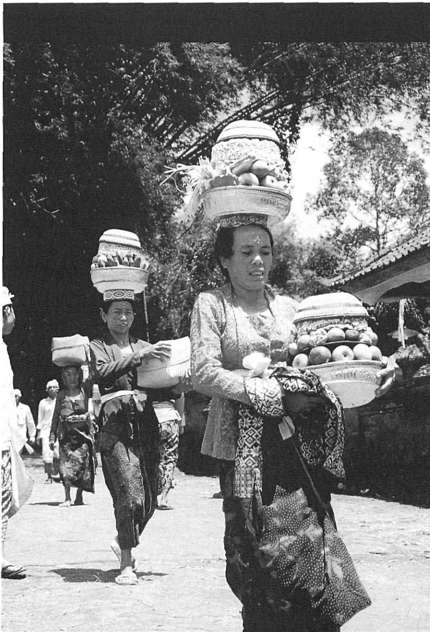
Ofrenes als déus en el temple de Sebatu, al llarg de la temporada sagrada de l' odalan .

febre. Una passió incontrolable. Cada camperol té el seu campió particular, que entrena amb dedicació. Tenir un bon animal és sinònim d'èxit, de prestigi. I és que a Bali, com a tants d'altres països de l'Extrem Orient, les baralles de galls són un negoci camuflat de tradició. Cada combat és l'excusa per fer mil i una apostes, i aquesta passió va arribar a uns extrems que el govern va haver de prohibir-ne la pràctica. Però per evitar una més que segura rebel·lió balinesa, Jakarta accedeix que al llarg de l' odalan , una festivitat religiosa, tin-