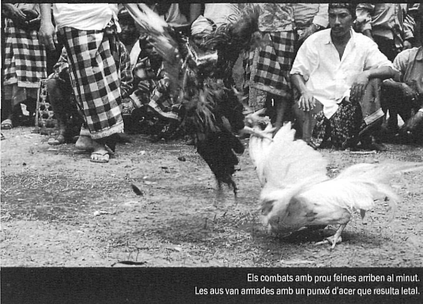
Els combats amb prou feines arriben al minut. Les aus van armades amb un punxó d'acer que resulta letal.