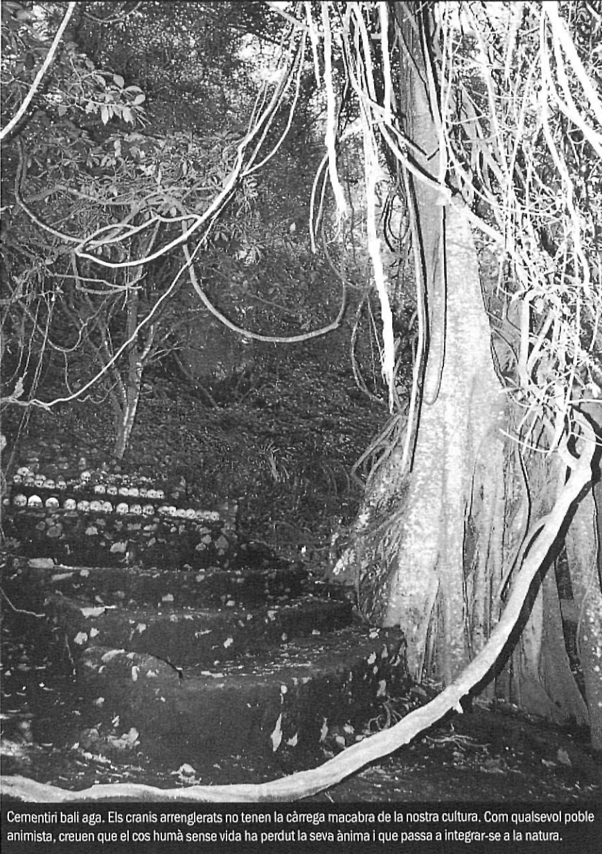
Cementiri bali aga. Els cranis arreglats no tenen la càrrega macabra de la nostra cultura. Com qualsevol poble animista, creuen que el cos humà sense vida ha perdut la seva ànima i que passa a integrar-se a la natura.

cas és que el caràcter balinès, tan respectuós amb els forans, explica que —a diferència d'altres països de l'Estat oceànic on hi ha hagut incidents i violència, com a les illes Moluques, Sumatra o el tristament famós cas de la neteja ètnica a Timor— aquí les dues comunitats convisquin aparentment sense gaires complicacions. Almenys fins ara. No és estrany veure els musulmans una mica pertot arreu, sobretot a les botigues i els negocis.