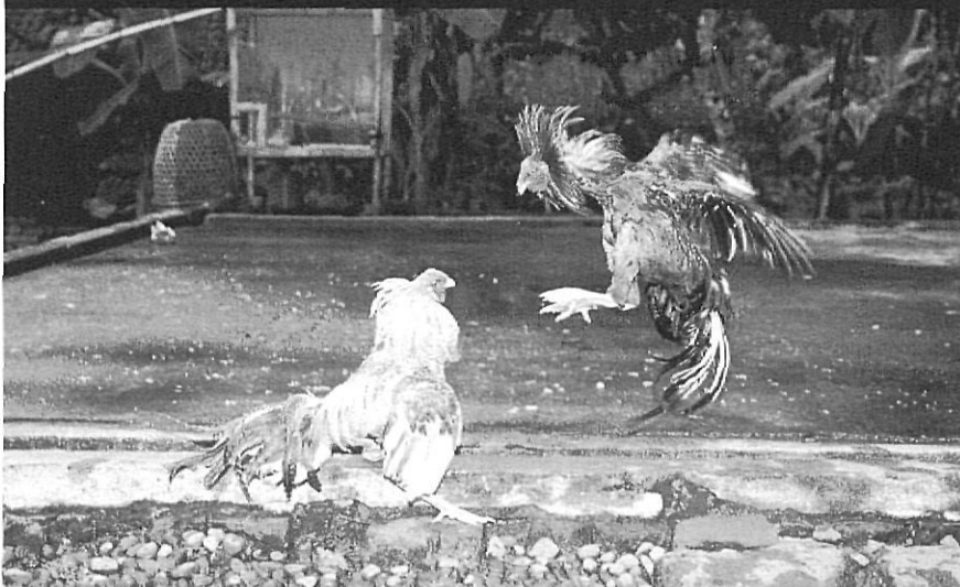
Detall d'una baralla. Al seu voltant s'aplega una gernació que fa les seves apostes segons l'evolució del combat.