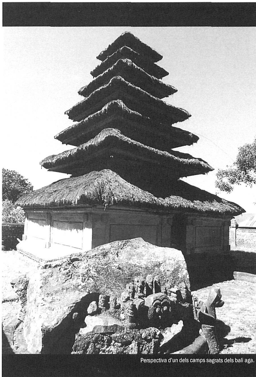
Perspectiva d'un dels camps sagrats dels balli aga.

Les baralles de galls són una altra mostra del caràcter balinès. A l'antiguitat, la sang d'aquests animals purificava els ritus religiosos. Però avui dia han esdevingut més aviat una