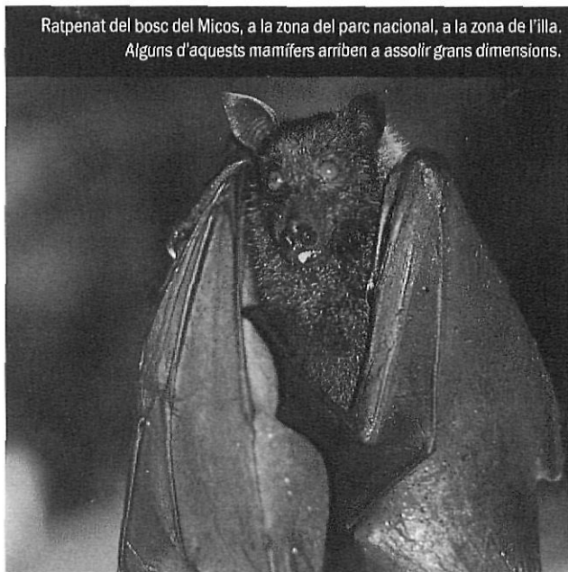
Ratpenat del bosc del Micos, a la zona del parc nacional, a la zona de l'illa. Alguns d'aquests mamífers arriben a assolir grans dimensions.

Els autòctons entenen la maldat com un concepte per desterrar. Són gent sense malícia, que no poden comprendre què poden haver fet perquè et sentis malament: «què he fet jo perquè aquest home s'enfadi amb mi?», diran als déus, i demanaran que l'estranger no el contaminin d'energia negativa ni se senti vexat per la seva actitud. Aquesta gent mai tractarà d'enganyar-te i, com