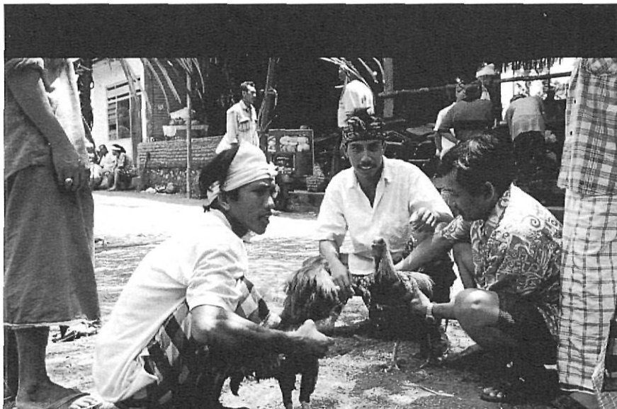
Animals entrenant-se en el temple de Sebatu, uns dels més coneguts de l'illa. Les baralles de galls són l'esport nacional, tot i que estan oficialment prohibides per les autoritats centrals.

Si hi ha dos conceptes que defineixin Bali aquests poden ser mort i lluita. Naturalment, les danses balineses, tan conegudes, barroques i belles, també són un bon exemple. I fins i tot, en