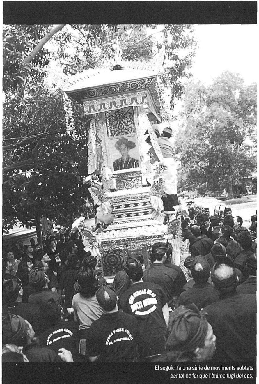
El seguici fa una sèrie de moviments sobtats per tal de fer que l'ànima fugi del cos.

El centre de l'illa és un espai gairebé sense tocar per la mà de l'home —de fet és una reserva natural nacional—. Allà és on trobem boscos selvàtics i innumerables animals, des de senglars salvatges fins a micos, serps, peixos de diferents tipus i altres. El nord-oest és el territori on encara sobreviuen les cultures animistes anteriors a l'arribada de l'hinduisme. És un espai cultural que es perd en la nit dels temps, i que deixa les restes dels seus morts descomponent-se lentament al bosc. El sud i sud-oest és l'àrea per excel·lència de la cultura balinesa moderna, allà on van florir els regnes hindubalinesos més poderosos abans de la colonització holandesa i que actualment ha esdevingut un reclam turístic de primera magnitud, amb les imatges de postal dels temples, les danses, les terrasses i la cultura illenca. Finalment, l'est és el sector on el govern central de Jakarta du a terme la seva política de transmigrasi —o emigració—, que consisteix a incentivar, planificar i facilitar l'arribada de javanesos de religió musulmana a l'illa, però també ciutadans de Borneo, per tal de crear una identitat indonèsia, si és que això és possible en un conglomerat de 13.600 illes! El