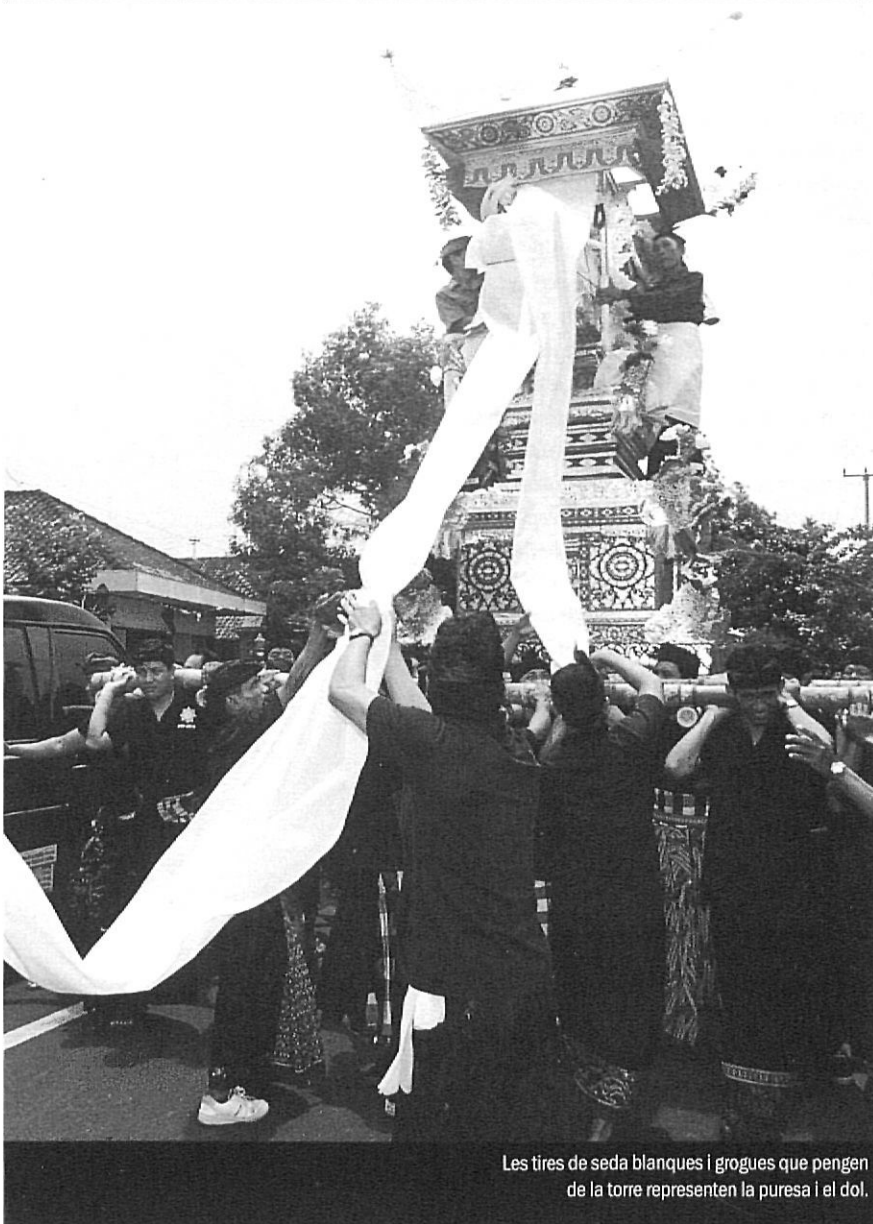
Les tires de seda blanques i grogues que pengen de la torre representen la puresa i el dol.