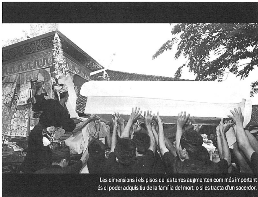
Les dimensions i els pisos de les torres augmenten com més important és el poder adquisitiu de la família del mort, o si es tracta d'un sacerdot.

Les platges balineses són calentes i inacabables, sorrenques i obertes, envoltades de corall. Pròpies d'una foto de prospecte turístic. Quan hi aneu, no us refieu gaire d'allò que us diguin els autòctons. Al principi d'estar-hi, nosaltres hi anàvem a banyar-nos cada dia, unes cinc hores, i vèiem tots els turistes nedar i prendre el sol tranquil·lament als hotels. I pensàvem «Quin comportament més estrany, amb la sensació tan agradable que és caminar damunt la sorra i nedar en aquestes platges oceàniques!». Però aviat vam descobrir-ne la raó. Dos o tres dies més tard, mirant al terra, vam veure desenes de serps d'aigua lliscant al nostre voltant i cercant l'aigua. «Són inofensives», ens deien a l'hotel. Però vam decidir no comprovar-ho i banyar-nos, com tothom, a les piscines. I el cas és que als balinesos no els agrada gens el mar; la seva cultura mira envers l'interior i diu que l'aigua està poblada de monstres ferotges i perills innombrables. Potser segles abans ja intuïen que la civilització occidental que tant de mal els havia de fer arribaria, precisament, pel mar.