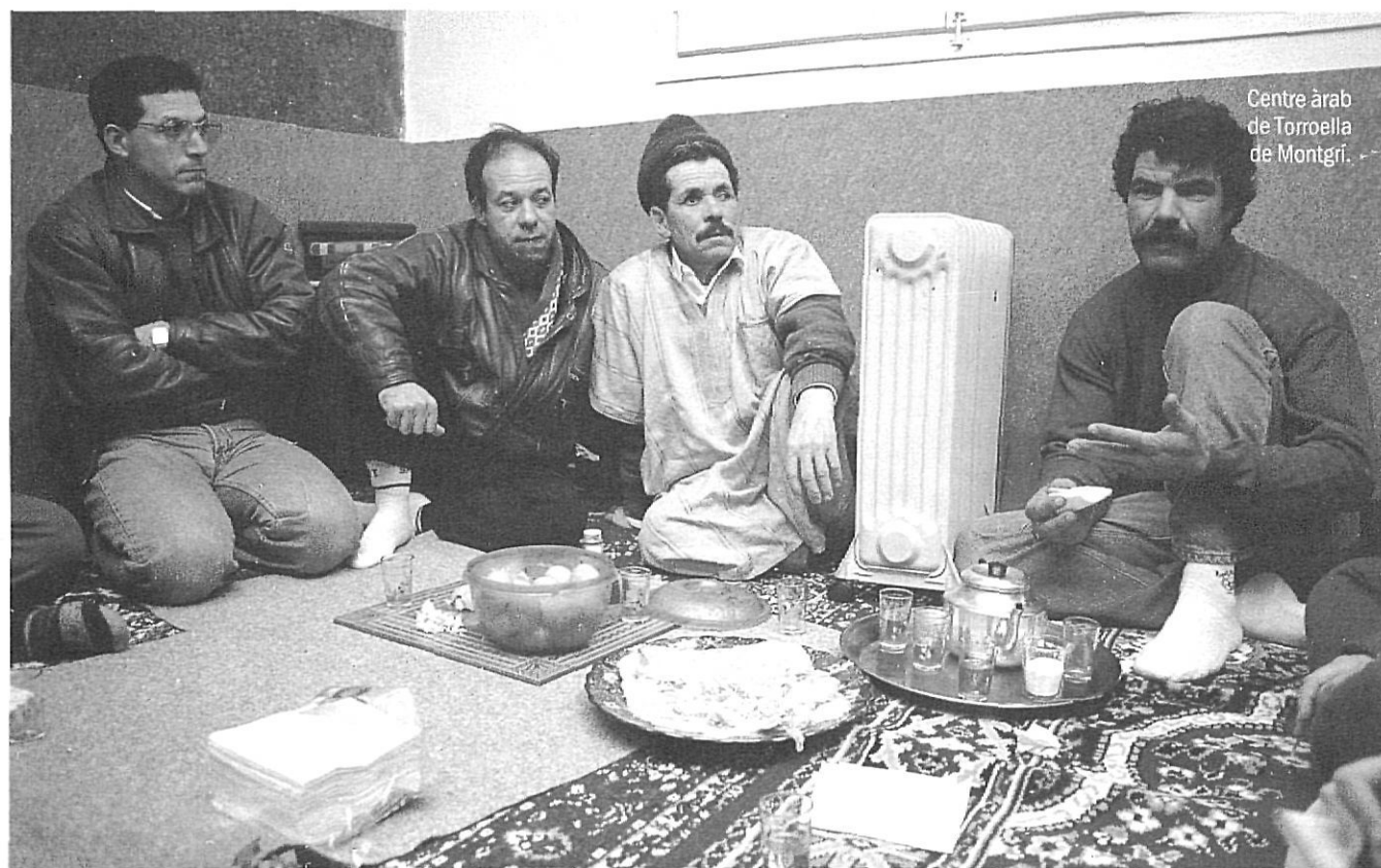
Centre àrab de Torroella de Montgrí.