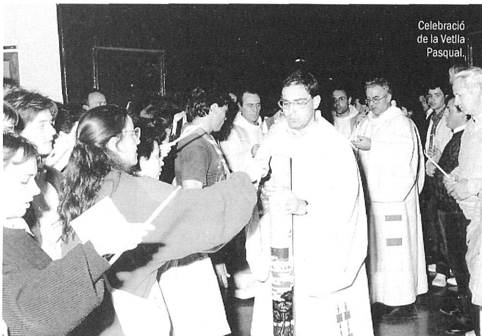
Celebració de la Vella Pasqual.

Al llarg d'aquests anys hi ha hagut altres entitats amb una representació notable, com la Comunitat de l'Emmanuel, però moltes vegades la seva presència depenia de persones que no han pogut assegurar-ne la continuïtat després de desvincular-se'n. En el món associatiu dels laics a Catalunya, però d'una manera especial a Girona, hi ha el sentiment comú que és difícil arrelar; per això el manteniment de moviments i comunitats vives seguirà sent un dels reptes de futur, perquè tot indica que els seglars continuaran guanyant pes i responsabilitat en l'animació de l'Església catòlica.