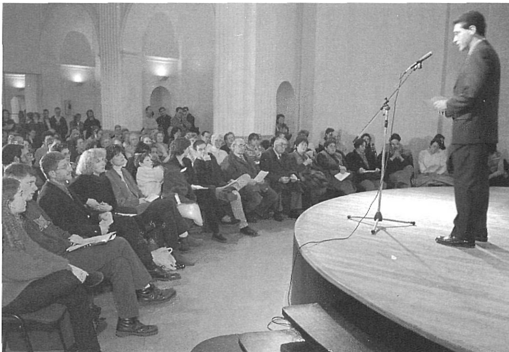
Trobada interconfessional de cristians a Girona.

i Calella de la Costa. En total es reuneixen unes 100 persones, tot i que el compromís personal és molt flexible.