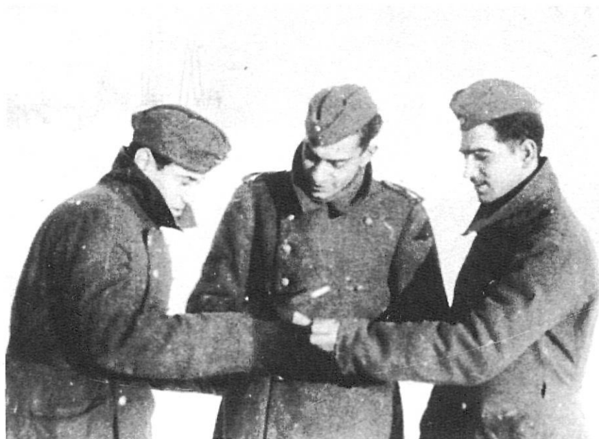
El voluntari calongí -a la dreta- amb dos companys més al front de Rússia. La zona estava totalment nevada.