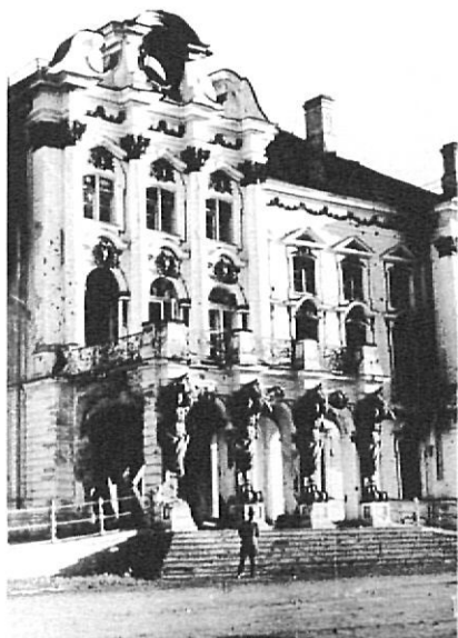
Davant un palau de l'antiga Rússia.