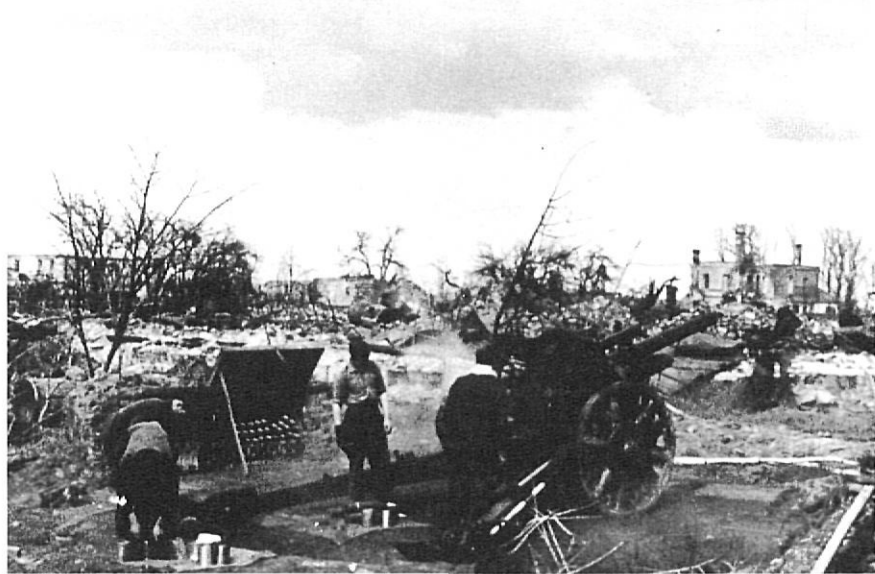
Una peça d'artilleria en plena acció al front de Rússia. Es pot veure que està prop d'un nucli urbà per la presència d'immobles.