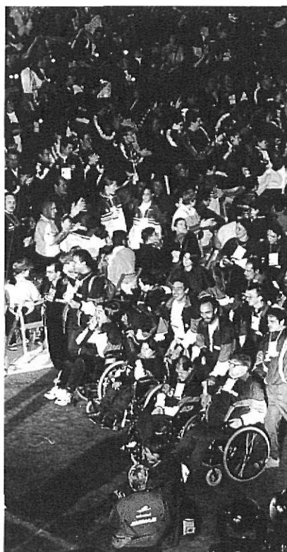
Inauguració dels Jocs Special Olympics, a Figueres.

s'han referit als Special Olympics com l'esdeveniment social més important que s'ha produït a la ciutat al llarg del segle XX. Una opinió que pot semblar agosarada, però sí que és cert que cap situació viscuda en els últims cinquanta anys a la capital alt-empordanesa havia estat capaç de crear un clima humà com el que es va viure del 12 al 15 d'octubre. Els jocs han suposat una injecció de moral per als disminuïts psíquics i la gent que treballa amb ells, i han servit de gran aprenentatge per a la resta de la societat. Els que van assistir-hi com a espectadors o es van implicar en la seva organització van treure el tel a valors que la competitivitat de la societat actual té tendència a tapar.