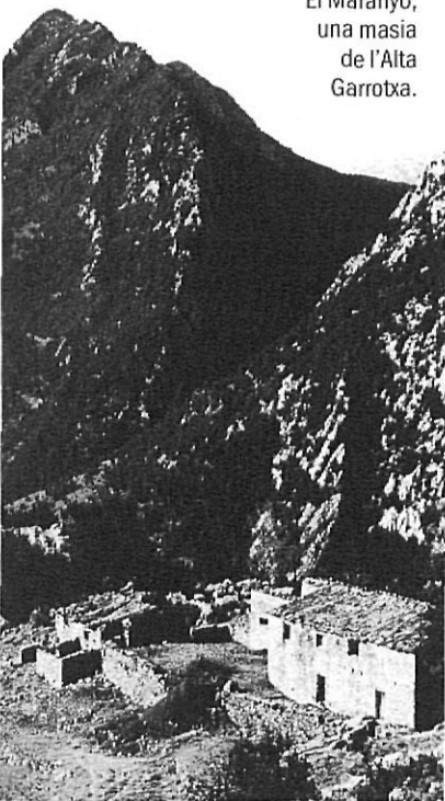
El Maranyó, una masia de l'Alta Garrotxa.

La imatge resultava almenys tan profètica —lamento haver de fer-ho constar— com l'acabament d'aquell text: «I amb ell [i.e. Eudald Graells] desapareix inevitablement el museu que pensàvem conèixer». El passat dia 30 de novembre, en una sessió del ple-