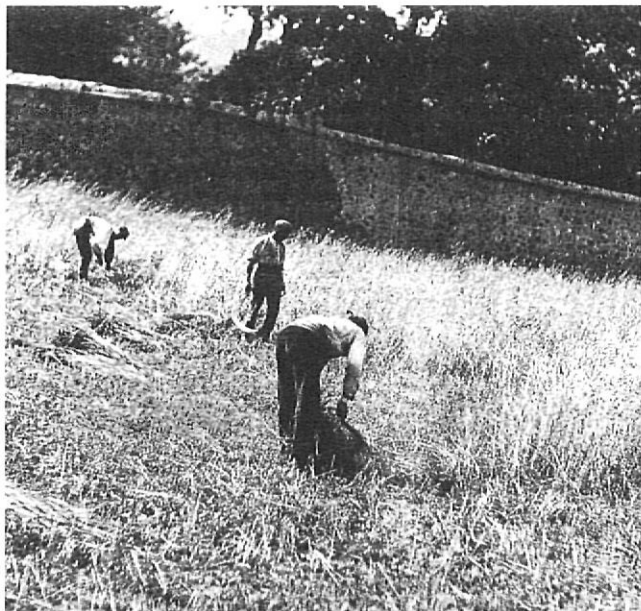
Segadors en un camp de blat.

i els mals usos eren prou importants com per desestabilitzar l'economia dels masos remences i per explicar l'alçament armat i les guerres que aquests van protagonitzar a partir de 1462. Segons altres i per contra, els pagaments dels mals usos eren molt poc importants, o gairebé simbòlics i per això tenien molt poc –o res– a veure amb la situació real dels remences.