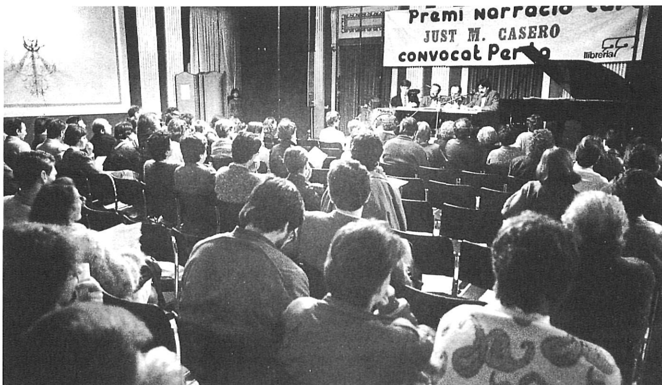
La concessió del premi ha tingut diversos escenaris: la sala La Planeta, l'Institut vell, l'auditori de La Mercè i (a la imatge) el saló de descans del Teatre Municipal.

car l'acte a les 12 del migdia, però el veredict no es va conèixer fins a les 2 de la tarda, perquè el jurat no es posava d'acord. A aquella hora, les autoritats municipals que havien anat a l'envelat de la Devesa ja no hi eren, perquè havien hagut d'anar a la inauguració de les fires. El premi va generar una gran expectació i a l'envelat hi havia molta gent, però era tan gran que semblava buit. Per tal que aquests problemes no es repetissin, a la convocatòria següent el jurat va acordar que decidiria el guanyador abans de l'acte i els organitzadors van buscar un local més petit. L'entrega del premi es va concebre com un acte senzill, un divertimento que havia de trencar el tòpic dels actes literaris solemnes i nocturns;