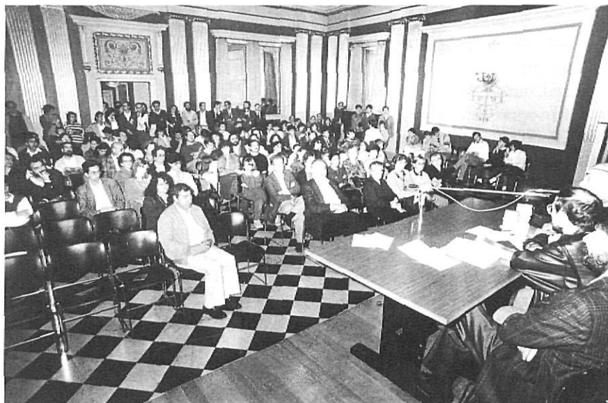
Els assistents a la festa, l'any 1987.

Les obres guanyadores del Casero s'han dividit en dos tipus: les que han provocat immediatament