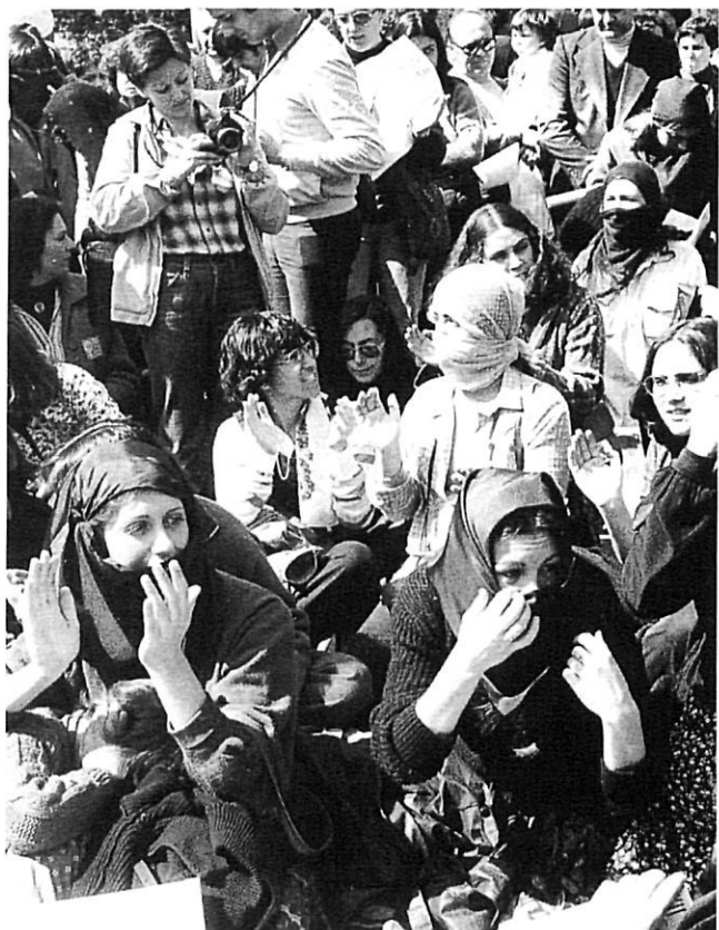
«L'Any Internacional de la Dona va obligar l'Estat espanyol a abordar algunes reformes.»

Tot aquest panorama, especialment pel que fa a la dona casada, va començar a ser tan impresentable que la declaració de l'Any Internacional de la Dona, el 1975, va obligar l'Estat espanyol a abordar algunes reformes, ja que en cas contrari la Sección Femenina no s'hauria pogut presentar als congressos internacionals que s'apropaven, amb unes lleis tan arcaïques. Aquesta nova reforma, però, també va ser poc significativa, únicament va eliminar de les lleis aquells aspectes més escandalosos, i no va ser fins a l'adveniment de la democràcia que es van produir les autèntiques reformes en la situació familiar, de la dona i també dels fills.