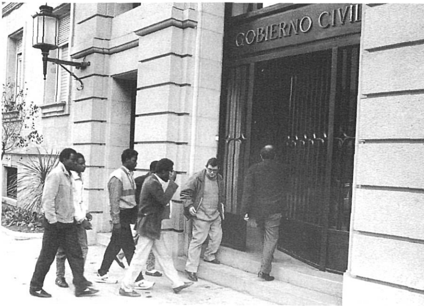
L'educació dels immigrants estrangers no es pot deslligar de la lluita per la igualtat jurídica i social.

Aquest fet desencadena un seguit de reaccions, marcadament racistes, que donen una gran força a la Samba Kubally i que marquen clarament la seva orientació ideològica i educativa. Tres dies després d'iniciar-se el curs, divuit africans no poden arribar al col·legi públic Sant Salvador d'Horta –lloc on es fan les classes– perquè els ho impedeix la policia municipal, que els reclama un «carnet d'identitat municipal» per poder circular pel poble. Els fets són denunciats per l'associació d'africans, alhora que es promou una recollida de signatures de suport a l'actuació de l'Ajuntament entre els colomencs i es rebenten les rodes d'una dotzena de cotxes d'immigrants, es cremen dues motos també d'africans i apareixen diverses pintades amenaçadores. La Samba Kubally, vist el caire que pren la situació, llença un crit de socors que és contestat amb un important moviment de solidaritat –ajuntaments, escoles, universitats, sindicats, associacions, etc.– que dona lloc a col·laboracions de tota mena, econòmiques, materials i humanes.