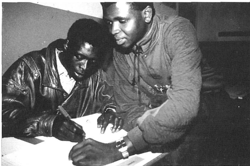
Les escoles d'adults oficials no estaven preparades per atendre les necessitats formatives dels immigrants africans.

Les eleccions municipals de 1991 fan que l'alcaldia canviï de mans, i això permet d'iniciar un diàleg i una col·laboració fins llavors inexistents. Les activitats de la Samba Kubally es traslladen a un local de l'Ajuntament, el Casal Cultural, un antic hospital que posteriorment va acollir els estudis de formació professional.