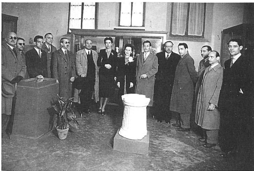
Inauguració de la Sala d'Empúries, al Museu Arqueològic de Sant Pere de Galligants el 25 d'octubre de 1944.