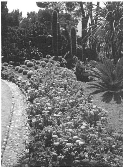
Els jardins de Cap Roig, a Palafrugell.

anomenat «nova museologia» (Congrés ICOM de Lisboa, 1985).