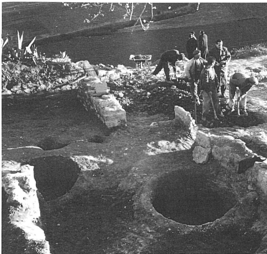
Treballs d'excavació al Puig de Sant Andreu d'Ullastret, el març de 1961.

Respecte a la segona de les lleis esmentades, s'ocupava d'organitzar