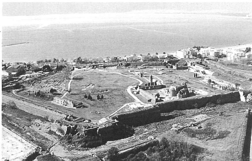
La Ciutadella de Roses.

tallar. També va assumir la responsabilitat d'excavacions arqueològiques com Ullastret, el conjunt de la Ciutadella de Roses, el Puig Rom, el poblat ibèric de Sant Julià de Ramis, diferents derelictes, l'Arbreda... Va crear museus com el d'Ullastret (1961) i va adquirir la farmàcia de Llivia (que anys més tard va esdevenir museu), sense oblidar la creació del Patronat Francisc Eiximenis, la Revista de Girona i del Servei d'Arqueologia, ja esmentats.