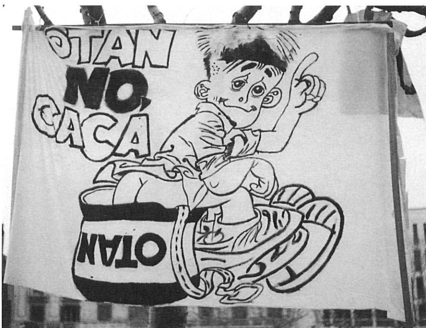
Cartell de la campanya del referèndum sobre la permanència a l'OTAN, l'any 1986.

Després de quaranta anys sense eleccions, al llarg del període que va de 1977 fins al 2000 s'ha produït una recomposició dels partits polítics. Els partits consolidats a l'Estat —amb representació parlamentària— són el Partido Socialista Obrero Español, la coalició de partits comunistes o afins a Izquierda Unida i el Partido Popular (abans Alianza Popular i Unión de Centro Democrático). A Catalunya s'han consolidat el Partit dels Socialistes de Catalunya (PSC-PSOE), Convergència