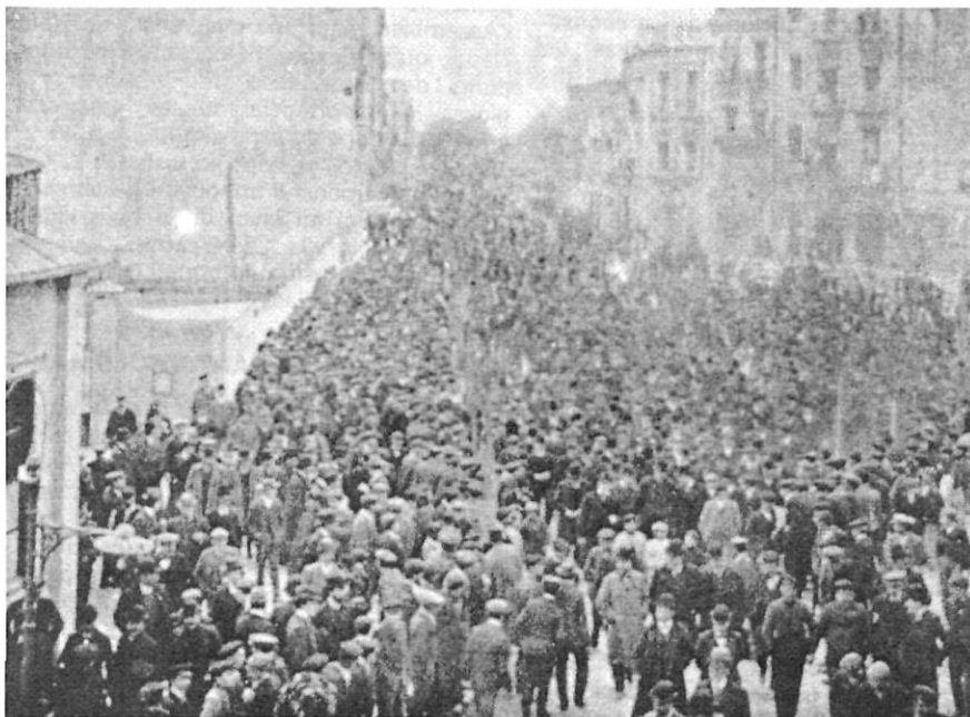
La plaça del Marquès de Camps de Girona, després de l'arribada dels trens especials per assistir al miting de Solidaritat Catalana, l'11 de febrer de 1907.

El govern municipal de Girona fou compartit per representants dels partits dinàstics i els d'influència cata-