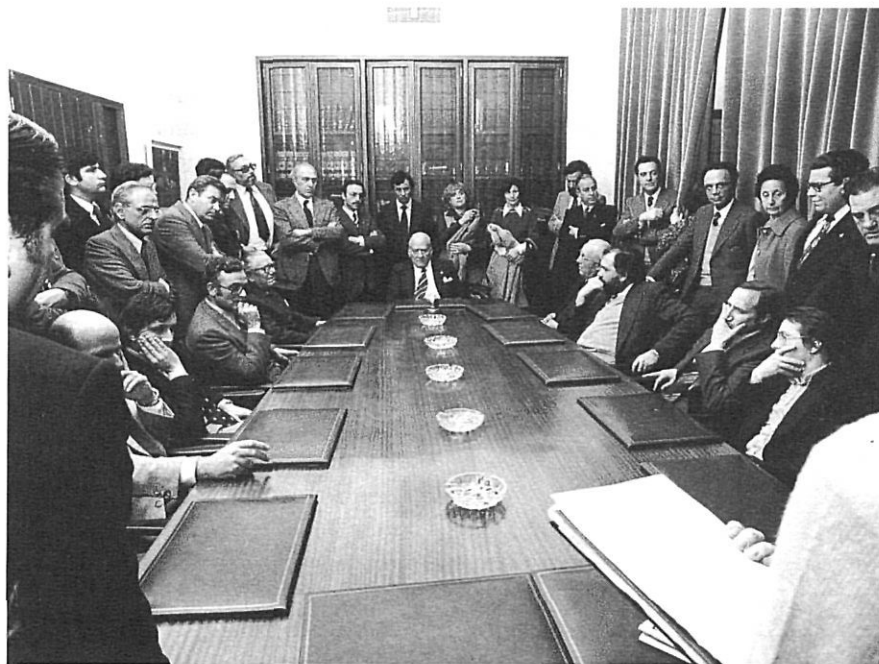
El president Tarradellas, de visita a la Diputació de Girona, l'any 1978.

dústria, del comerç, del funcionariat i de les professions liberals.