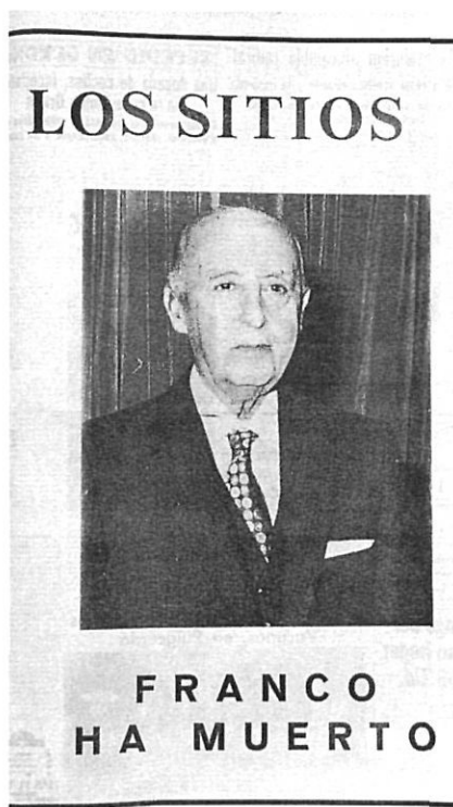
Portada del diari "Los Sitios" del 20 de novembre de 1975.

S'iniciava l'etapa més dura i repressiva de la història de la Catalunya contemporània dins l'Estat espanyol. A la repressió política i sindical que assolà Espanya s'afegí, en el nostre cas, la repressió cultural i institucional. A la derogació de l'Estatut, la supressió de la Generalitat i la prohibició de partits i sindicats els seguí la