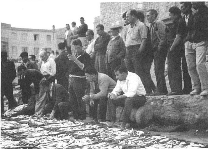
Subhasta de sardines a la Riba Vella de L'Escala, l'any 1957.

introducció de materials nous i el volum d'ormeigs calats són les diferències més destacables respecte als mateixos instruments de fa cent anys.