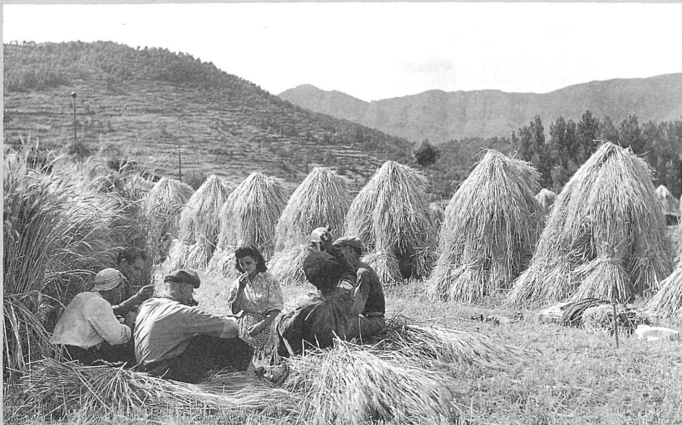
La sega al pla de la Moixina, d'Olot, l'any 1948.