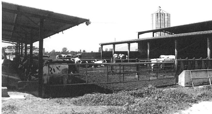
Instal·lacions d'una explotació agrària.

La segona crisi estigué motivada per la competència comercial dels cereals ultramarins en un dels primers episodis del que avui coneixem com a globalització de l'economia. Mai més tornà a haver-hi a Girona tanta superfície conreada o tanta densitat de població rural com en el període 1860-1880. Malgrat les mesures aranzelàries adoptades durant la dècada de 1890, ambdues crisis varen posar sobre la taula el problema de la sobreproducció i la necessitat de trobar