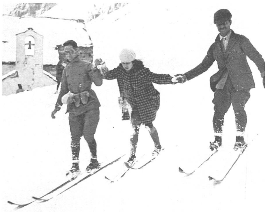
Esquiadors prop de l'ermita de Sant Gil, de Núria, els anys 20.

El xalet del CEC de la Molina, de 125 places, i que fou aixecat sobre els fonaments d'un edifici a mig construir conegut com el Corral Nou del Sitjar, va permetre l'organització de la primera competició oficial d'esquí de muntanya, l'hivern de l'any 1927. La prova era puntuable per al Campionat de Catalunya d'esquí de muntanya i els participants varen haver de pujar i baixar el Puig d'Alp i el Puigllançada. A poc a poc, la Molina començà a prendre importància en aquest incipient esport. L'any 1943 es va construir el primer telesquí, al 1944 es va crear l'Escola d'Esquí de la Molina, i al 1947 va entrar en funcionament el primer telecadira de tot l'Estat, que va ser l'origen de l'actual estació alpina.