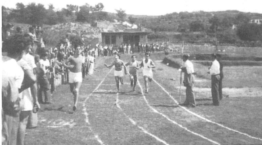
Atletisme a l'estadi de les Pedreres, de Girona, l'any 1937.

Catalunya, que funcionava a Barcelona des de l'any 1890. Tot i que el col·lectiu va haver de ser inscrit al Gobierno Civil amb el nom de Agrupación Excursionista Gerundense, des del principi l'entitat fou coneguda popularment com el Grup.