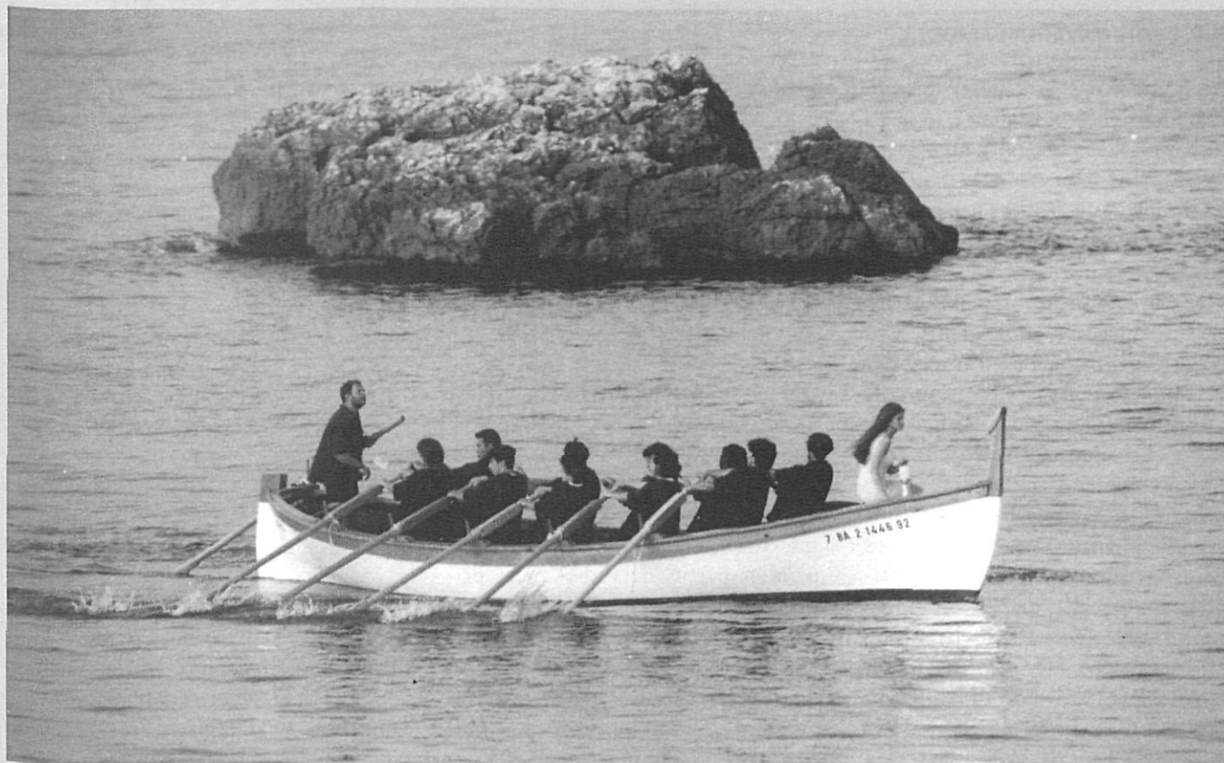
Arribada a Sant Martí d'Empúries de la flama dels Jocs Olímpics de Barcelona, l'any 1992.