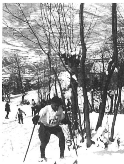
Proves d'esquí a fons a Ribes de Freser, l'any 1917.

estat i serà en el futur un punt d'atracció per als regatistes no tan sols de Catalunya i la resta de l'Estat, sinó també de tot el món. Al llarg del segle han estat diverses les competicions organitzades en els camps de regates dibuixats sobre les aigües del litoral gironí i també varis els clubs o les ciutats costaneres que les han propiciat.