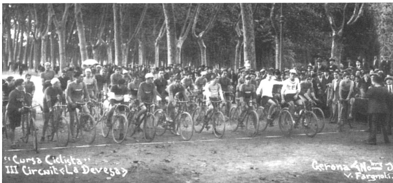
Cursa ciclista a la Devesa de Girona, l'any 1931.

recuperar el dia 1 d'abril de 1941. Tres anys després, el dia de Tot Sants, s'inaugurà l'estadi de la Devesa, de manera que abans d'arribar a la meitat del segle, ja s'havien creat noves seccions, com la d'handbol, una de les que més ha destacat a la segona part del segle juntament amb