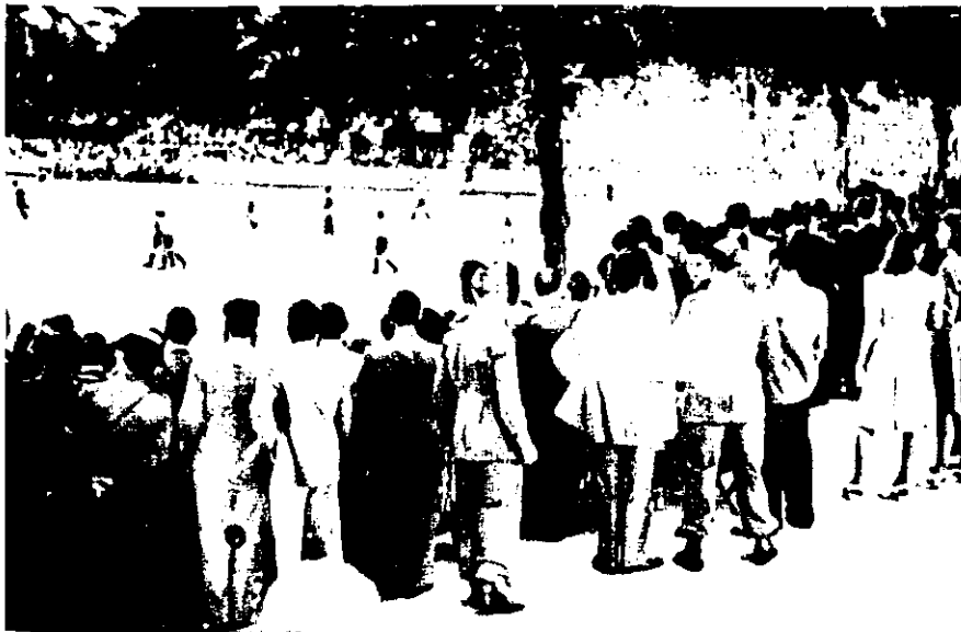
Partit de futbol al camp de Vista Alegre de Girona, els anys 40.

Un altre dels clubs de futbol destacats d'aquestes comarques és el Figueres. La Unió Esportiva Figueres es va crear el 13 d'abril de 1919 i la premsa de l'època ho va explicar dient que s'havia produït la unió de les societats esportives Sport Club Català, del Casino Menestral, i la Joventut Esportiva i Artística, del Casino Sport Figuerenc. Com que uns jugaven amb la camiseta blanca i els altres amb una de blava, la fusió dels dos colors va simplificar la feina de dissenyar un nou mallot, que va ser el tradicional de ratlles blanc i blau. Fins a jugar a l'horta de l'Institut —el primer camp—, l'equip buscava qualsevol espai per poder practicar aquest esport i fins i tot ho va fer a la plaça d'armes del castell de Sant Ferran. Uns anys després de la seva creació, la Unió ja jugava el campionat provincial, i al 1922 l'equip assolí el primer títol de campió provincial.