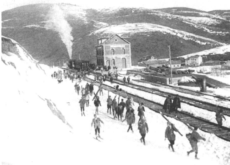
Arribada d'esquiadors a la Molina, els anys 20.

De manera paral·lela al muntanyisme, la pràctica de l'esquí va començar a guanyar adeptes. Les comarques de Girona varen ésser també pioneres en aquest esport i, des dels primers anys del segle, alguns esquiadors ja lliscaven pels vessants de les muntanyes dels Pirineus de Girona, a la Molina o a Núria. Fou precisament a la Molina, aprofitant que el ferrocarril havia arribat l'any 1923 fins a Puigcerdà, on el Centre Excursionista de Catalunya va decidir construir, l'any 1924, un ampli xalet per a la pràctica del nou esport de l'esquí, que cada dia tenia més adeptes. El xalet fou inaugurat el 5 de desem-