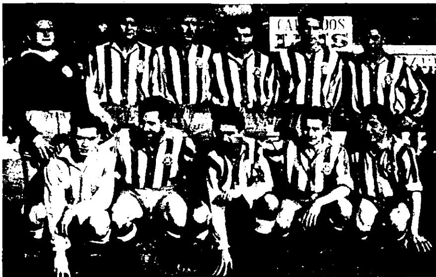
Primer partit a casa de la lliga d'ascens a segona divisió del Girona FC, l'any 1956: Girona 5 - Vilafranca d'Oria 0.

La primera meitat dels anys seixanta no varen ser bons per al Figueres, i tot i que al 1965 l'equip tornava a pujar, l'any següent feia una altra passa enrera. El club va viure entre penes i glòries fins arribar als anys 80, dècada que ha estat qualificada com la de la il·lusió. Les grans campanyes a la Copa del Rei i els ascensos de tercera a segona B i d'aquesta categoria a la segona A —l'any 1986, i de la mà de José Manuel Esnal «Mané»— van conformar