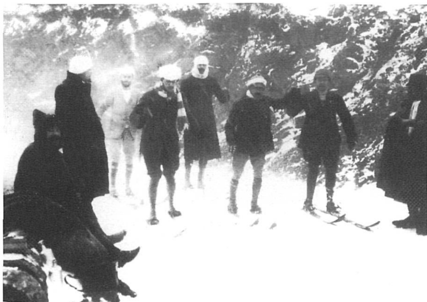
Primeres esquiades a la collada de Toses entre el 14 i el 17 de gener de 1909.