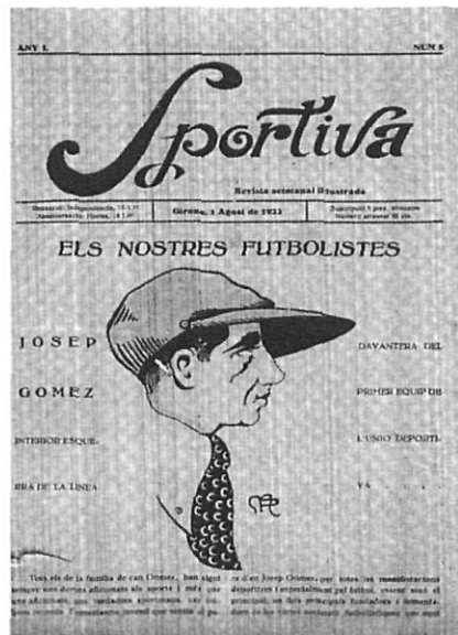
Portada de la revista "Sportiva", de 1922.