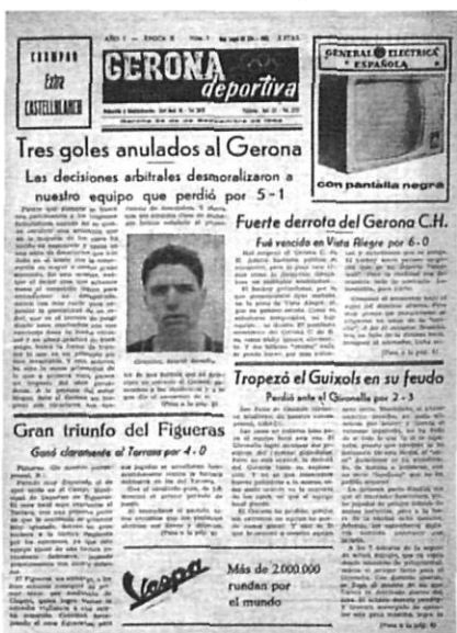
Portada del setmanari "Gerona Deportiva", de 1962.

Des del 1946 va jugar a la categoria regional, fins que al 1968 va aconseguir pujar a regional preferent. El següent pas endavant del Palamós va ser al 1987 quan, després de quedar sotscampió, va passar a militar a la tercera divisió. El trienni 1987-1989 es pot considerar com l'època daurada del club, ja que va anar pujant, any rere any, fins arribar a jugar a la segona divisió A del futbol estatal. Actualment el Palamós ha tornat a la tercera divisió.